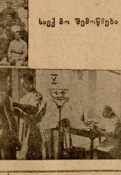
საემ მო შემწყვება

გასათვლი ბინა, სადაც ტარდებოდა მათ შორის აგრეთვე სხვა და სხვა ხასიათის საუბრები. ახალწახულთაგან მცირე რაოდენობა საკითხავისათვის პოლიტიკული და სხვა პოლიტიკური მუშაობისათვის. ვაწყვივ მათ ყაზაჩის კუთხეებზე, წითელარმიის მხრეშეუღდა, დისციპლინის, საბჭოთა ხელისუფლების სტრუქტურის, კომპარტიის სულს ვითელ არმიის და სხვა სატირო საკითხებს. ცნო-