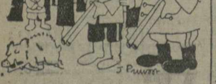
— Вы берите зверя, а я возьму Данцинг... (Маршан).

Официальная печать Польши указывала, что целью недавнего визита Геринга в Варшаву была охота в Беловежской пуше.