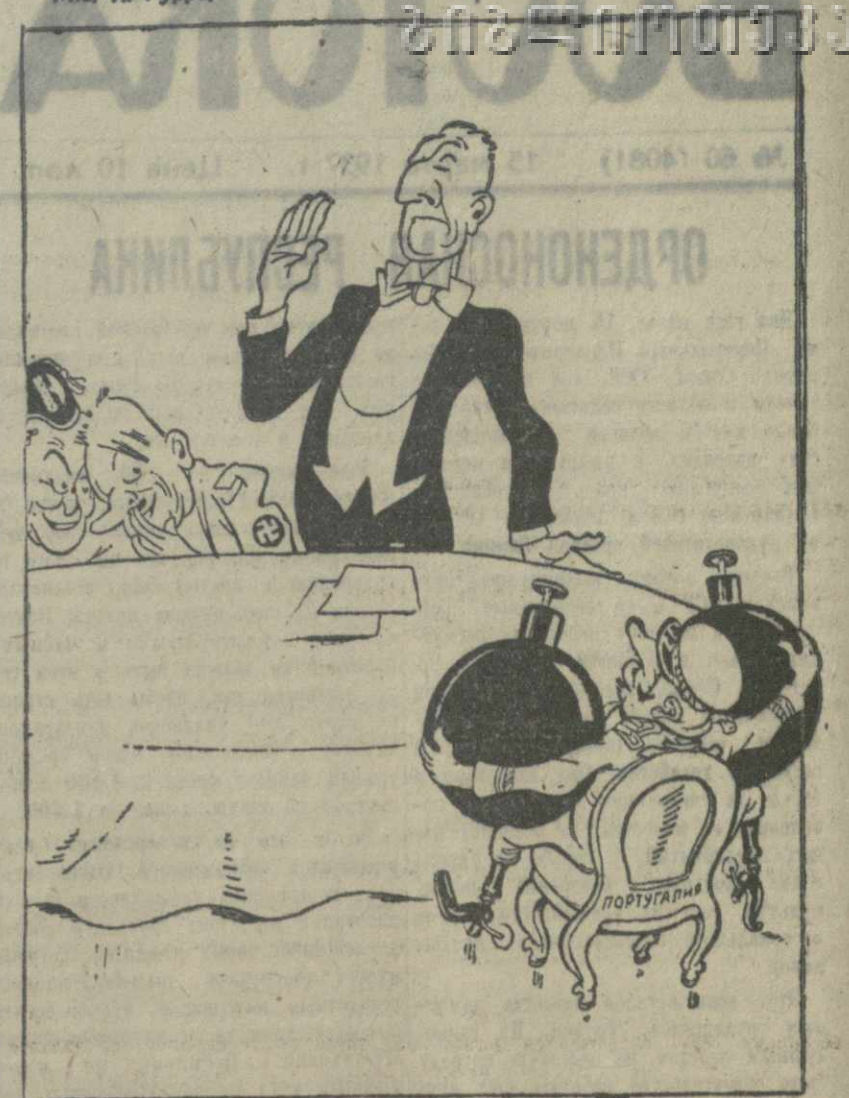
— Прошу не беспокоиться отныне этот добрый малый будет действовать под моим контролем.

В силу позиции, занятой Португалией, возникла над португальско-испанской границей необходимость в создании Лондонского комитета, в котором участвуют: