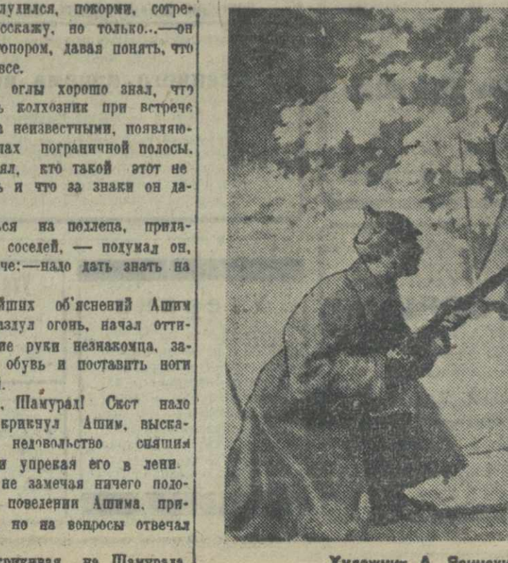
Художник А. Яонский — «Пограничники в борьбе с бандитами».

Ночь черным покрывалом укутала землю. Крутом тишина. Вековые сосны и ели, как причудливые фантастические великаны, охраняли этот покой. Только шум падающей с дерева шишки на скалу нарушил спокойствие, и снова тихо. По узкой горной тропинке, тихо и бесшумно двигается пограничный наряд. Он на минуту останавливается, напряженно всматриваясь вперед и по сторонам, прислушивается к малейшему шороху, и опять осторожно продолжает движение. Вот уже и поляна — пугливое место, через которое пытаются проклинать нарушители. Здесь тишина очень нарушается неприятным какаканьем лягушек. Вот распелся соловьиный болотный... — тихо бросает один пограничник другому. Эта поляна — ориентир для каждого пограничника, выходящего в наряд в данный район. Здесь все предметы знакомы. Вот столетняя ель, под которой приятно отдохнуть в жару, когда едет босс с пограничной постой; вот горелый пень, который не раз неопытные молодые пограничники ночью принимали за человека. Сделав короткую остановку и удостоверившись, что на поляне никого нет, пограничники идут дальше. Пересекли тихо журчащий ручеек и снова зашли в лес, который встретил их приятным запахом сосновой смолы. Дошли до места расположения сектора Старший наряд, красноармеец Ковалев внимательно осмотрел местность, прозвучав план действий на случай столкновения, коротко ознакомил с ним своего подчиненного, молодого красноармейца Панаева, указав ему место расположения, дал сектор на беду и в недалеком расположился сам.