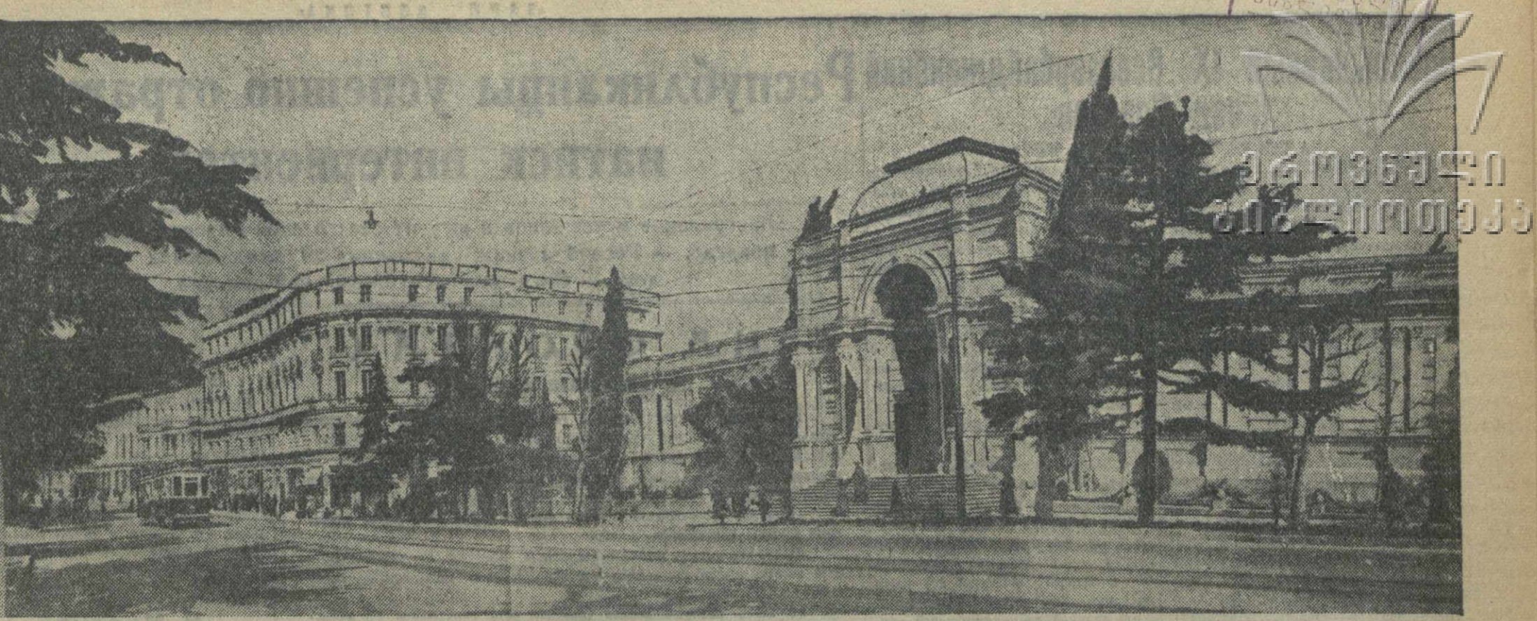
Столица орденоносной Грузинской ССР — Тбилиси. Вид на проспект Руставели.

Председатель Центрального Исполнительного Комитета Союза ССР М. КАЛИНИН. Секретарь Центрального Исполнительного Комитета Союза ССР И. АМУЛОВ. Москва, Кремль. 14 марта 1937 г.