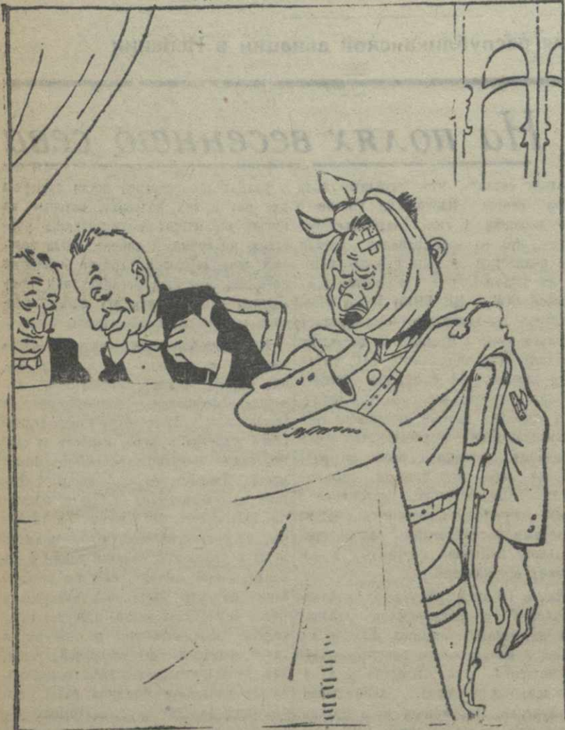
Скажи, что с г-ном итальянским делегатом? Ему поставили шпанскую мушку.