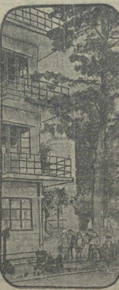
Жилые дома рабочих батумских нефтеперерабатывающих заводов.

По телеграфу и телефону от наших корреспондентов и Грузин