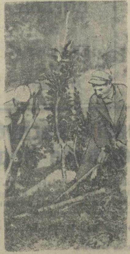
Внесение удобрений под цитрусовую культуру в Алабартском субтропическом совхозе.

По сообщению английской печати, в районе индо-афганской границы усиливается волнения (не так давно пограничные племена совершили нападение на колонии британских войск в Вазиристане. Два солдата были убиты, офицер и 8 солдат ранены. Английские войска, которых сопровождал самолет, в своем отряде, атаковали горцев и нанесли им потери. Несмотря на это два английских офицера, совершившие похищение в индо-афганской границе, также подверглись нападению и были убиты. Согласно заявлению, сделанному в Законодательном собрании Индии представителем от Северо-западной провинции провинции, племя в районе индо-афганской границы находится в состоянии «вынужденного бегства» в долину Инда. По этому сведению, волнения среди племен вызваны отчасти постройкой англичанами дороги в долине Хайвора. Представитель индо-афганской границы подтвердил на заседании Законодательного собрания, что в Вазиристане «существует значительное волнение». В связи с созданным положением, производится специальная переброска войск на индо-афганскую границу. В настоящее время в Вазиристане находится 1 батальон пехоты, одна батарея легкой артиллерии и отряд легких танков. В подкрепление к ним переброшены еще один батальон пехоты, несколько батарей артиллерии, части связи и санитарные части.