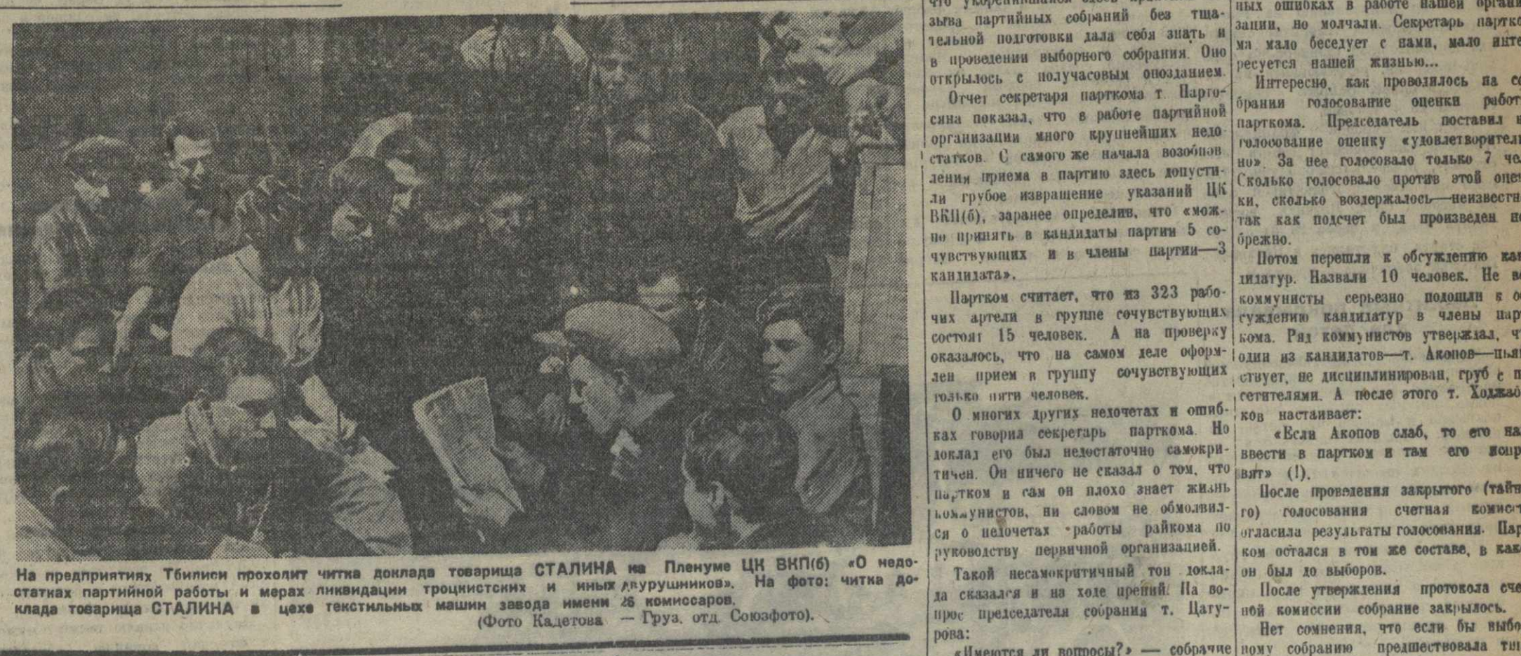
На предпринятой Тинелис проходит члтка доклада товарища СТАЛИНА на Пленуме ЦК ВКП(б) «О недостатках партийной работы и мерах ликвидации троцкистских и иных двурушничков». На фото: члтка доклада товарища СТАЛИНА в цехе текстильных машин завода имени 26 комиссаров.