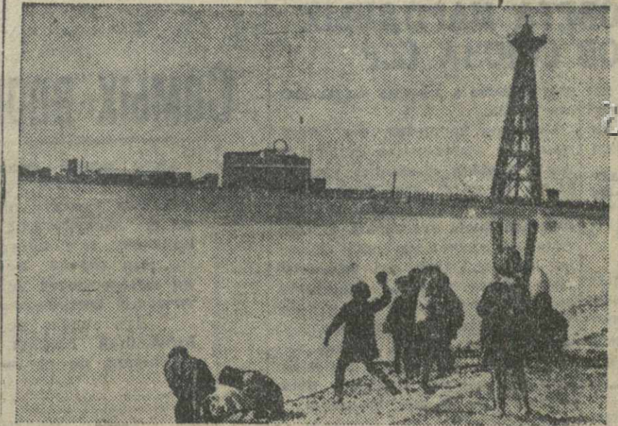
Батумский парк культуры и отдыха. На снимке: дети за игрой на берегу искусственного озера, устроенного в парке.

Завтра, 4 апреля, в 7 час. веч., в помещении редакции (ком. № 8) состоится ПЯТОЕ ЗАНЯТИЕ СЕМИНАРА ИМ. «ПРАВДЫ» редакторов стеновых фабрично-заводских газет «ЗАРЯ ВОСТОКА».