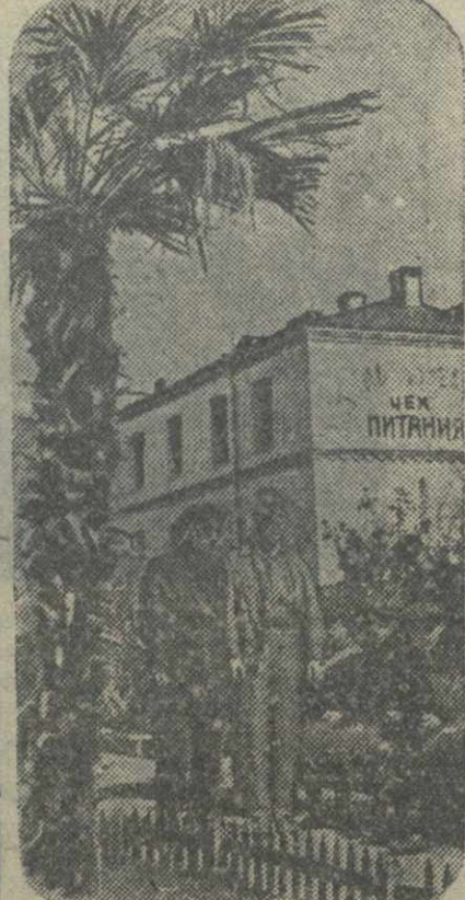
В Тбилиси на заводе имени 26 коммунар проведено озеленение заводской территории. На снимке: озелененный уголок завода около товарного цеха. (Фото Бухдзешского — Груз. отд. Союзфото).

По данным журнала «Американский автомобиль», в начале 1936 года в Америке насчитывалось до 75 тысяч трайлеров, а в 1937 году предполагается выпустить свыше 200 тысяч. Благодаря этому новому типу туристического жилья, на окраинах городов и на курортах возникли настоящие «города» трайлеров. В последнее время число таких блуждающих жилищ городов стало быстро расти. Трайлер является оригинальным решением жилищной проблемы для дачников и туристов. Однако, для широких масс трайлеры являются дорогими, вследствие их дороговизны, конечно, недоступны.