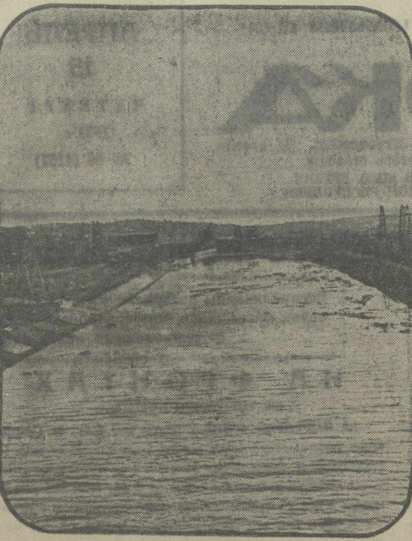
Канал Москва—Волга. Вид на канал у 3-го шлюза.

В настоящее время итальянский посол в Москве г-н Россо уведомил народного комиссара тов. Литвинова о том, что команды упомянутых судов интернированы на территории, занятой испанскими матежниками, и что пароход «Смидович» находится в одном из зажатых матежниками испанских портов.