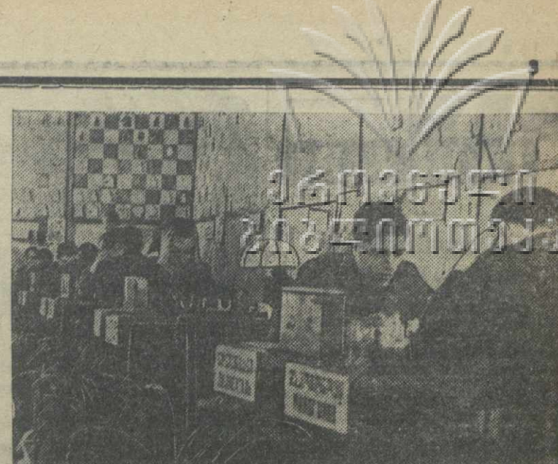
Общий вид эстрады концертного зала театра имени Руставели, где происходит X Всесоюзный шахматный чемпионат. На первом плане гроссмейстер Лиленталь и мастер Макогоню.