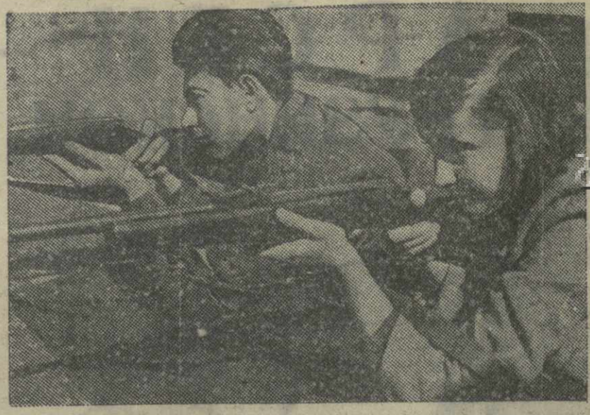
Молодежь Батуми готовится к сдаче норм на «воршильского стрелка». На снимке: учащиеся батумской школы им. Ленина, за тренировкой в стрельбе.