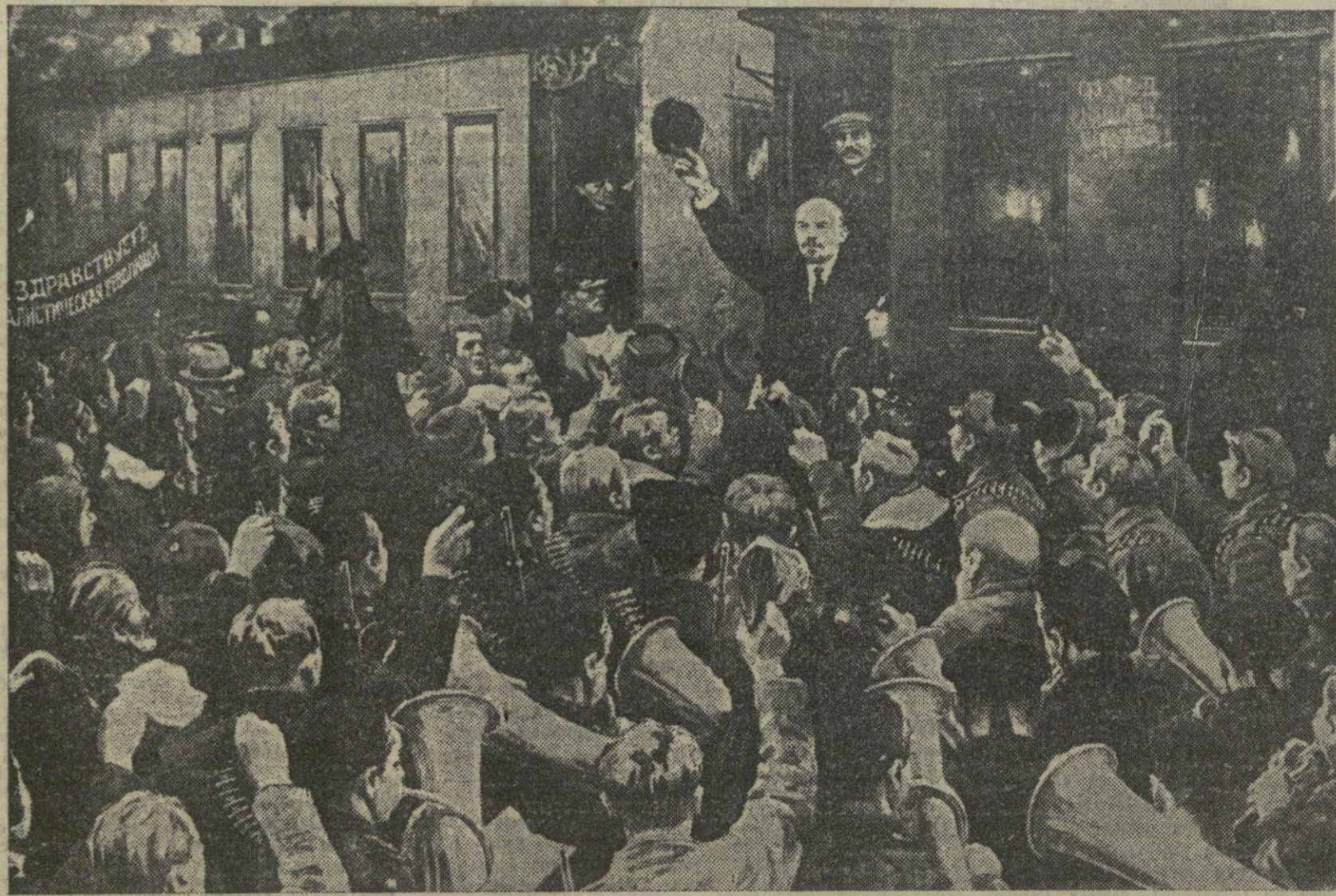
Приезд В. И. Ленина в Петроград 3 (16) апреля 1917 года. Репродукция с картины художника Соколова (из материалов Музея революции). (Союзфото).