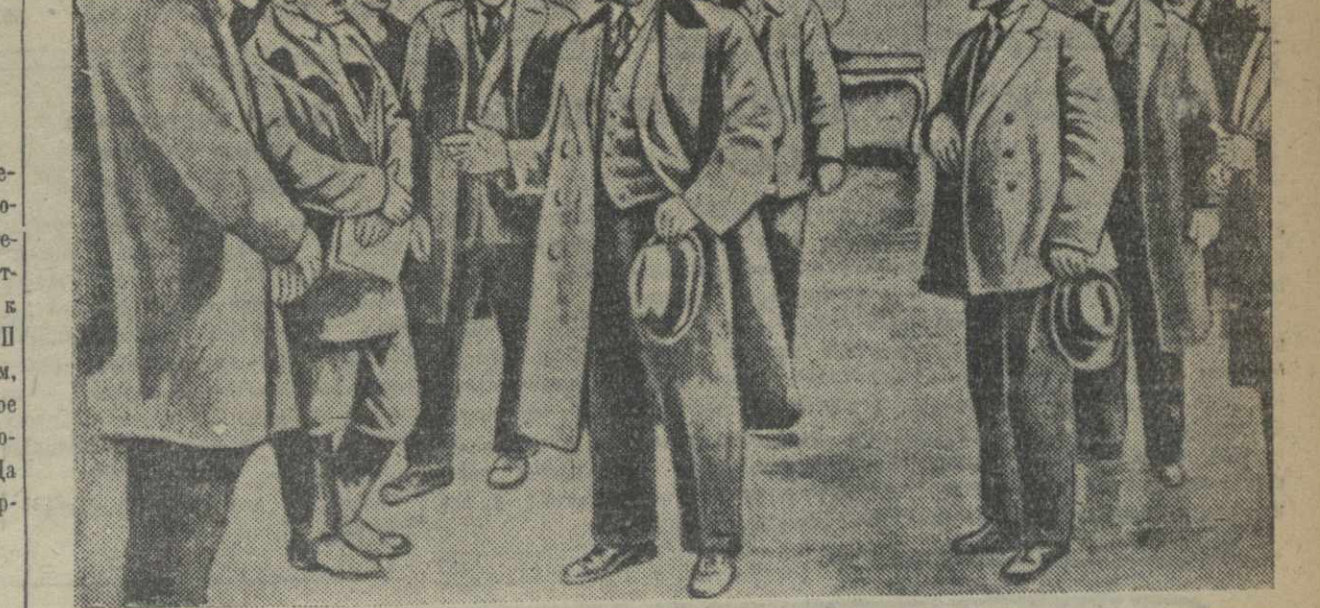
Приезд Ленина в Петроград. Встреча на Финляндском вокзале. Член ЦК прочитал Ленину целую нотацию... (Рис. Е. Машкевича—1-й том «Истории гражданской войны в СССР».)