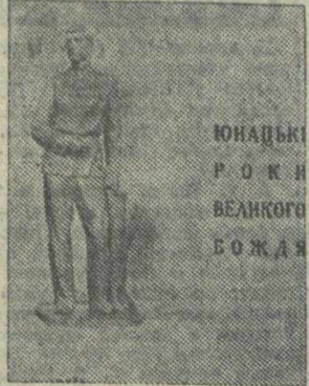
ЮНАЦЬКИ РОКИ ВЕЛИКОГО БОЖДА