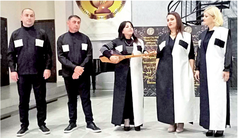
როგორც ითქვა, ფესტივალის მნიშვნელოვანი შემადგენელი ნაწილია სამეცნიერო კონფერენცია, სადაც სხვადასხვა ქვეყნის ეთნომუსიკოსი მეცნიერები, მართლაც, საინტერესო თემებს წარადგენენ, ერთმანეთს გამოცდილებას უზიარებენ.