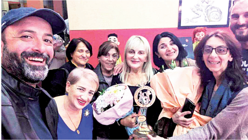
თეატრის, არამედ აჭარის რეგიონისა და ბათუმის გამარჯვებაა.

2018 წელს სპექტაკლმა უკრაინაში - კიევის II საერთაშორისო თოჯინურ ფესტივალზე „pUp.pet Up“ გამარჯვა ნომინაციაში „საუკეთესო ანსამბლი“, იმავე წელს, თეატრალური პრემია „დურჯის“ საიუბილეო მე-10 დაჯილდოებაზე, სპექტაკლისთვის „წერილი ჭერალდინას“ ელენე მაცხონაშვილის წლის საუკეთესო რეჟისორის პრიზი გადაეცა, ბათუმის თოჯინებისა და მოზარდ მსახიობთა პროფესიული სახელმწიფო თეატრის სამხატვრო ხელმძღვანელმა გაზეთ „აჭარას“ ჟურნალთან გაუზიარა შთაბეჭდილებები და აღნიშნა, რომ ეს გამარჯვება არა მარტო მათი