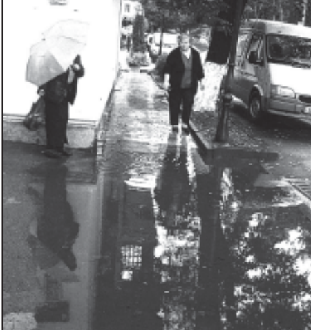
ნიმუში დაგვიტოვებს ქალაქის ცენტრში „სილამაზის ხიდის“ დასაწყისში — ფეხით მოსიარულეთათვის დასა-

მეგზევეებმა ვერც სანიაღვრე ჭებების განმუხდის საქმე მიიყვანეს ბოლომდე, თავსებმა წვიმების დროს ჭები წყალს ვერ ატარებს და საავტომობილო გზებზე ხელოვნური „ტბები“ იქმნება. ბევრგან ნაჩქარევად გაკეთებული სამუშაოები თავიდანაა გასაკეთებელი. იმედს ვიტოვებთ, მეგზევეები წლის ბოლომდე დარჩენილ პერიოდში დაამთავრებენ სამუშაოებს. საშურივალეს საავტომობილო ტრასა ხომ საერთაშორისო მნიშვნელობისაა და ამ გზაზე ათასობით მძიმეწონიანი ტრაილერები და მსუბუქი მანქანები გადაადგილდებიან. პალაიან ლოშია.