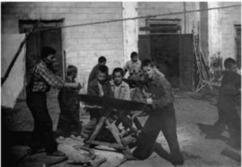
აღსაზრდელები ზამთრისთვის შეშას ამზადებენ