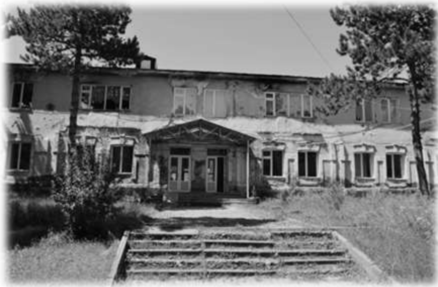
ქ. ხაშურის რკინიგზის N 1 ბავშვთა სახლის შენობა 2023 წელი.