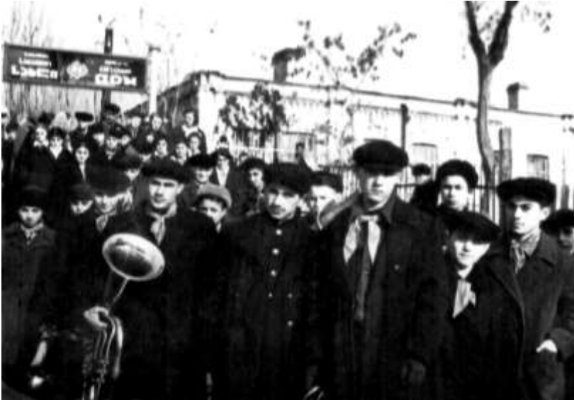
საბავშვო სახლის სასულე ორკესტრი