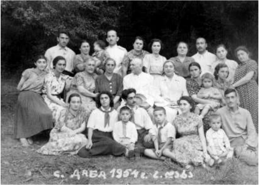
ქეთევან დავითაშვილი აღზრდილებთან და აღსაზრდელებთან ერთდ, სოფელ დაბაში, შეხვედრა პოეტ იოსებ გრიშაშვილი და მისი მეუღლე. 1954წ.