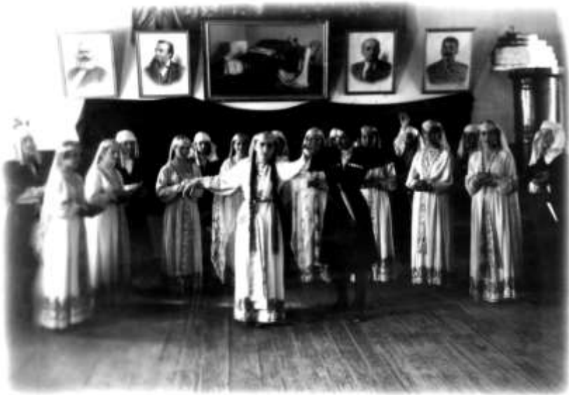
საბავშვო სახლის მოცეკვავეთა ანსამბლი