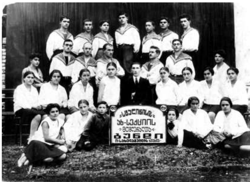
ხაშურის ახალგაზრდა მომღერალთა გუნდი