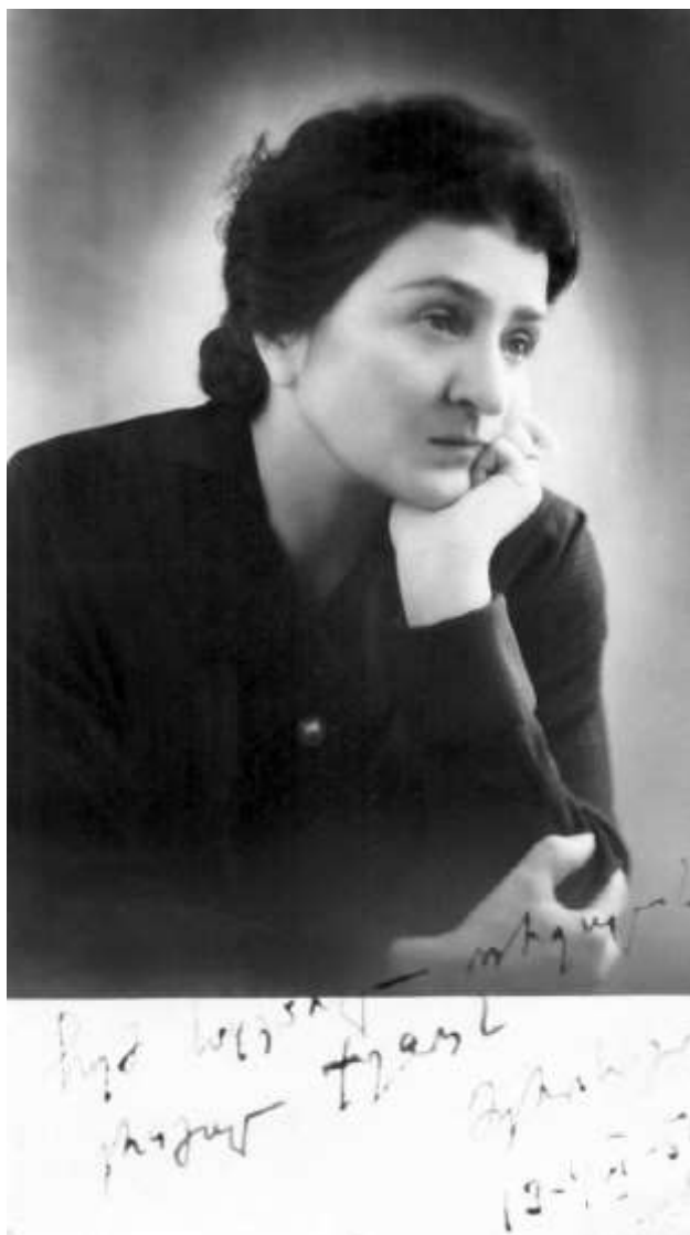
მერი დავითშვილი - საქართველოს სახალხო არტისტი

ფოტოზე წარწერა: ჩემ საყვარელ ორეულს ერთგულ ქეთოს მერისგან 13- IV -54 წ.