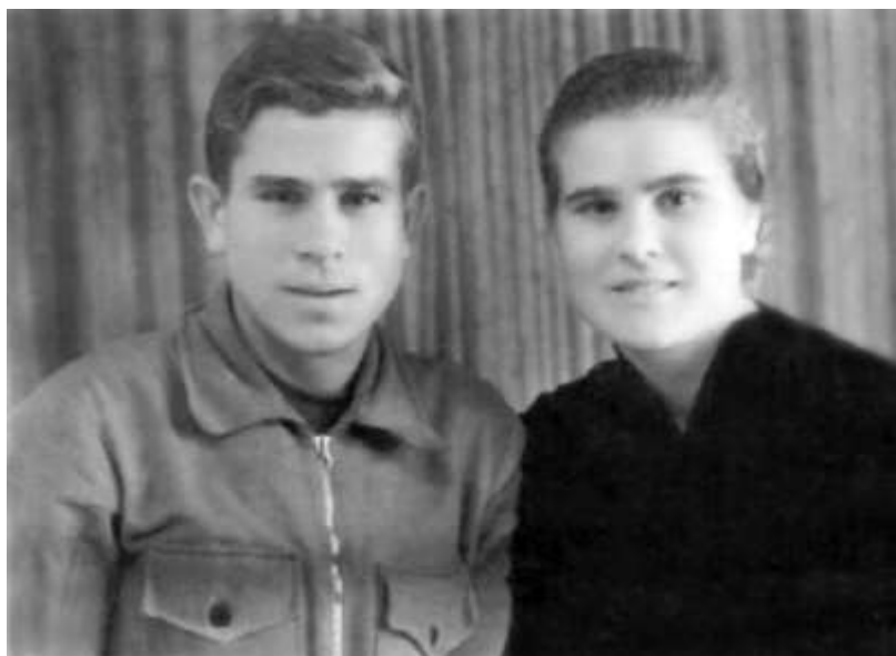
საბავშვო სახლის აღზრდილები და ძმა ბაკლაგინები