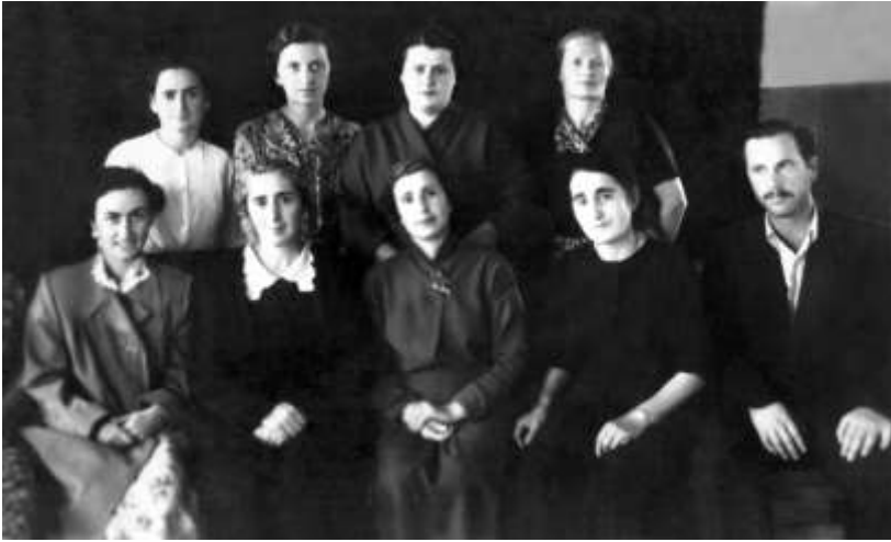
N1 საბავშვო სახლის კოლექტივი