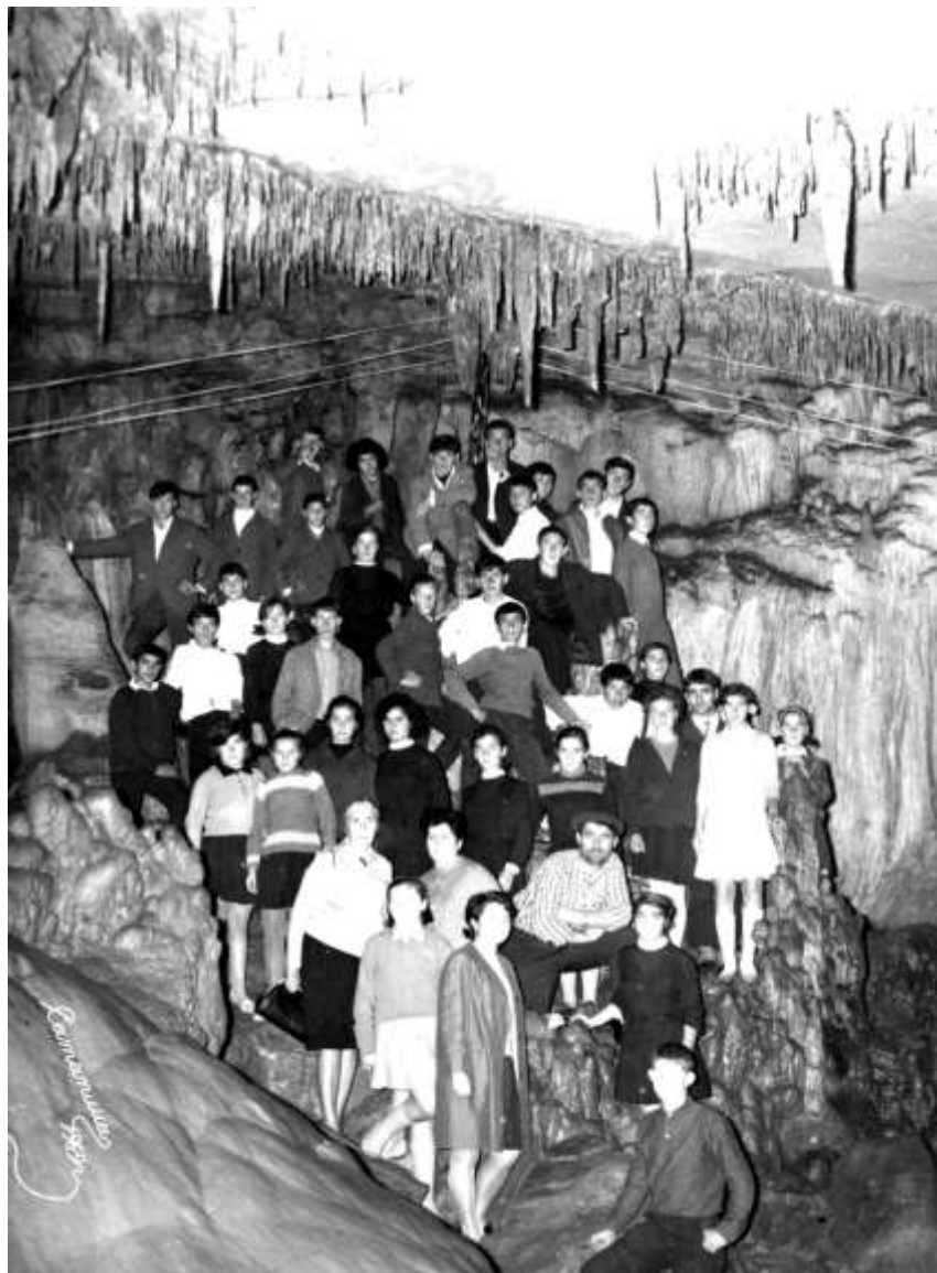
საბავშვო სახლის აღსაზრდელები ახალ ათონში 1969 წ.