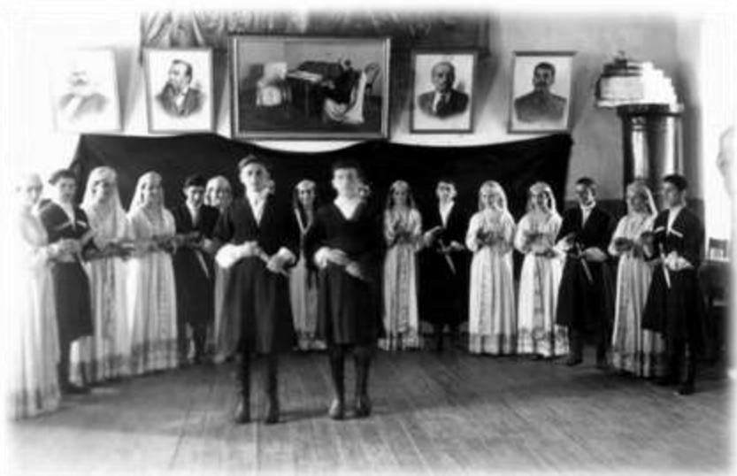
საბავშვო სახლის ქორეოგრაფიული ანსამბლი