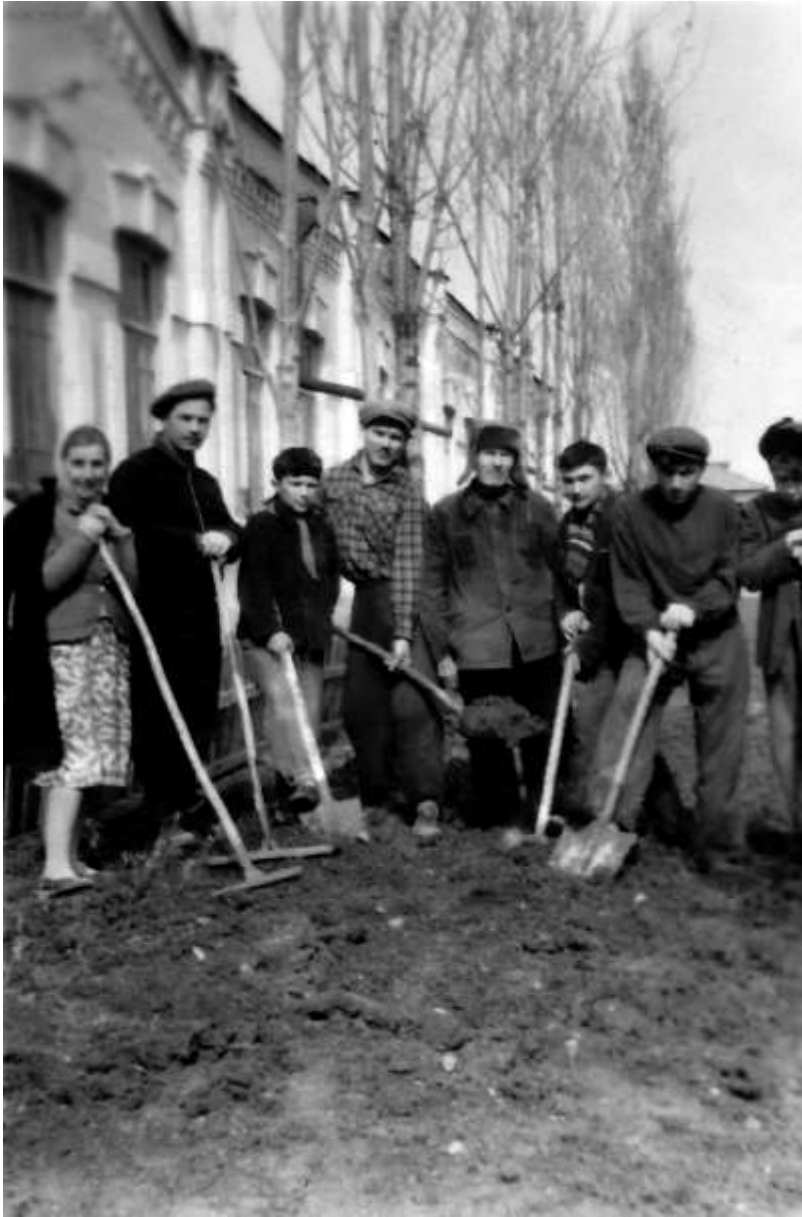
საბავშვო სახლის აღსაზრდელები და აღზრდილები შრომის დროს