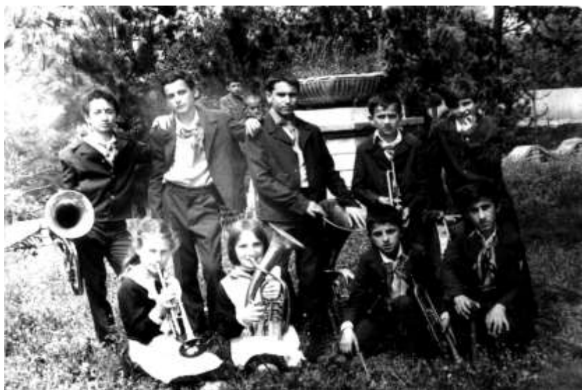
სასულე ორკესტრის წევრები