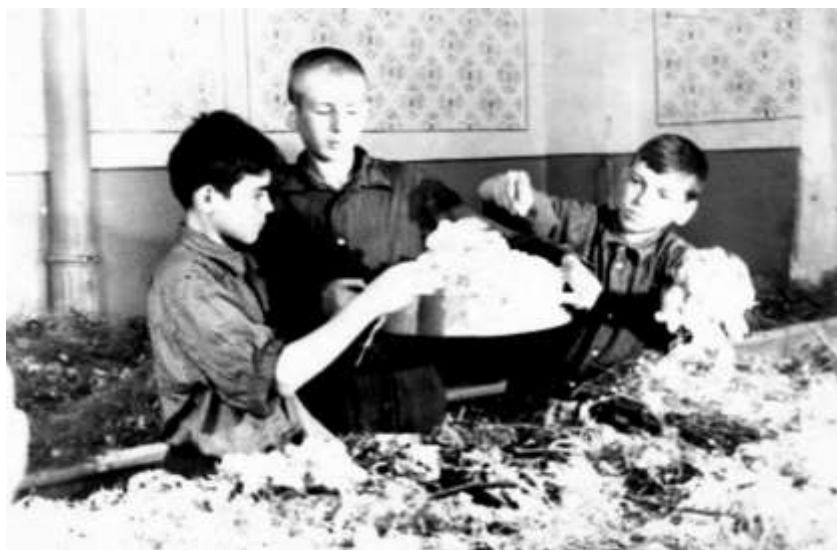
საბავშვო სახლის აღსაზრდელები აბრეშუმის ჭიის „მოსავალს“ წონიან