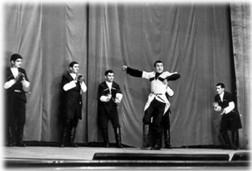
რკინიგზის ხაშურის კულტურის სახლში