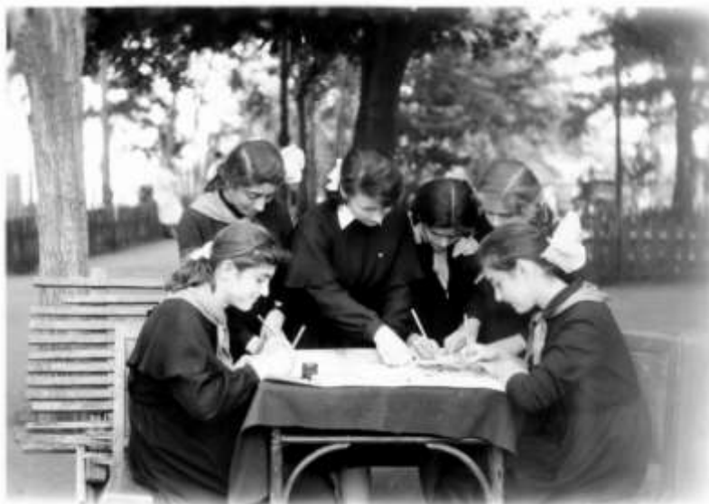
საბავშვო სახლის აღსაზრდელები კედლის გაზეთის ახალ ნომერზე მუშაობენ