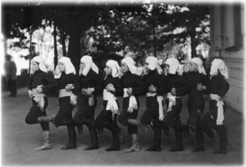
საბავშვო სახლის ქორეოგრაფიული ანსამბლი