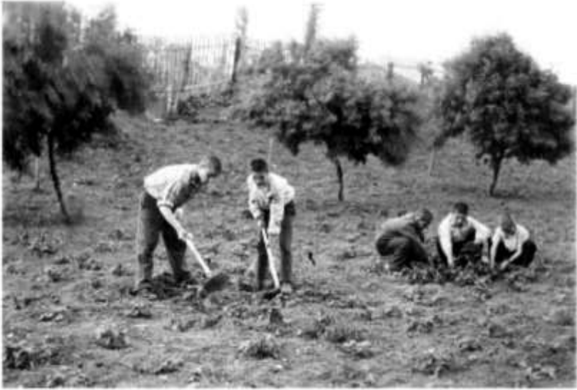
აღსაზრდელები საბავშვო სახლის ნაკვეთში მუშაობენ