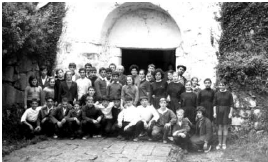
გელათში, დავითის საფლავთან