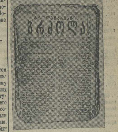
Фотоснимок с газеты «Пролетариатис Брзозла» («Борьба пролетариата»), выходящей в 1903 — 1905 годах.

Условием, что один звонок — означает тревогу, два звонка — объявляли нас выслать в бочку своими средствами, лишь бы не подступать к дому посторонних людей.