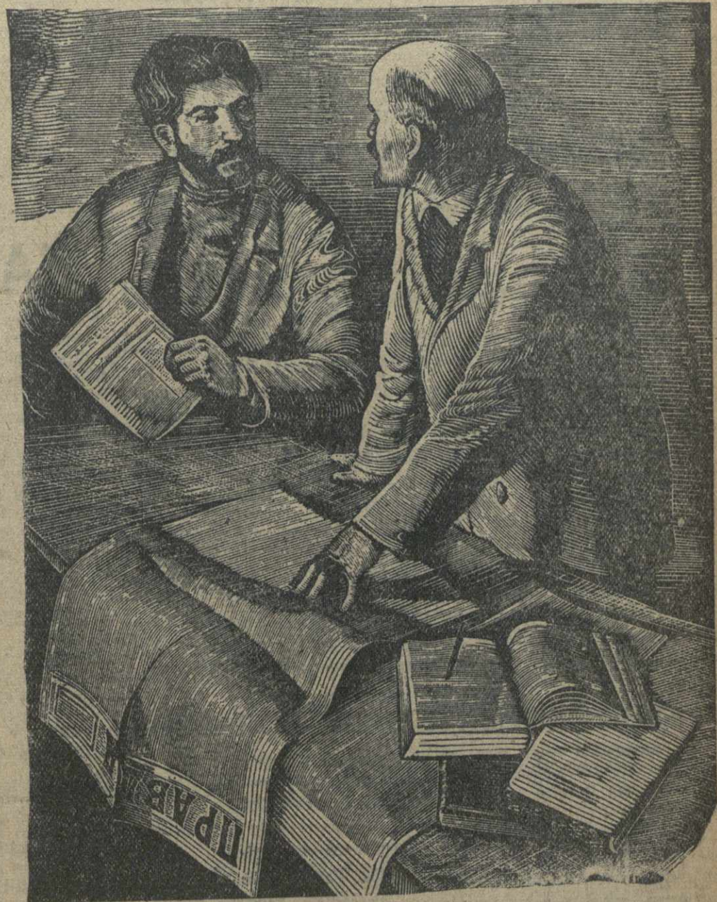
С гравюры Н. Староносова.

Теснейшая связь с массами — одна из славных традиций большевистской печати.