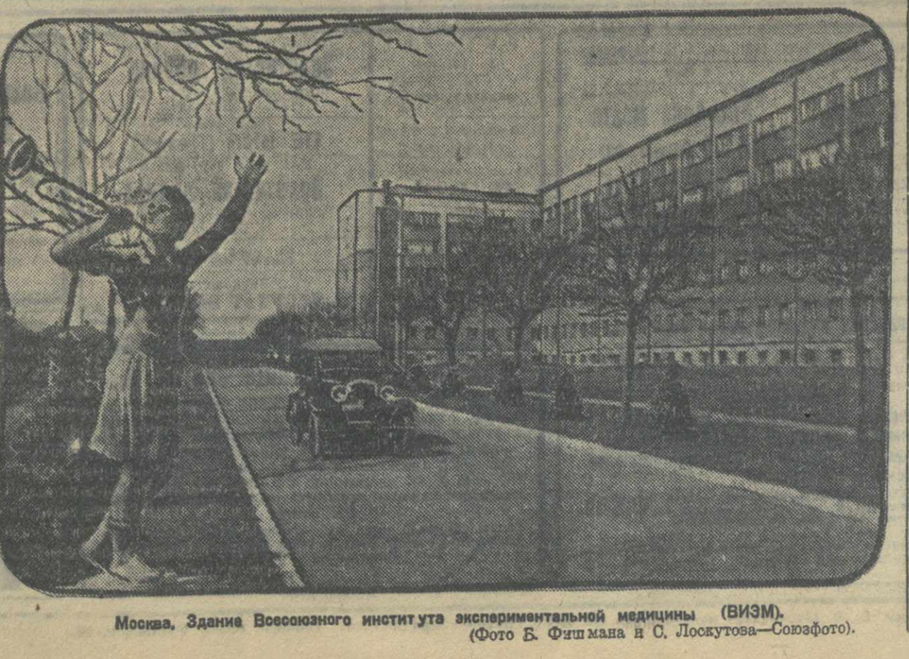
Москва, Здание Всесоюзного института экспериментальной медицины (ВИЭМ).

НЬЮ-Йорк, 2 (ТА). «Нью-Йорк Таймс» опубликовала корреспонденцию из Москвы, посвященную окончанию строительства канала Волга—Москва. Газета указывает, что строительство канала закончено в удивительно краткий срок. Последний помимо того, что он является крупным водным путем, представляет собой большое гидроэлектрическое сооружение. ЛОНДОН, 2 (ТА). Московский корреспондент «Обсервер» в большой корреспонденции сообщает, что канал Волга — Москва. Корреспондент указывает, что канал является выдающимся сооружением второй пятилетки, гораздо более грандиозным, чем знаменитый Днепровский канал.