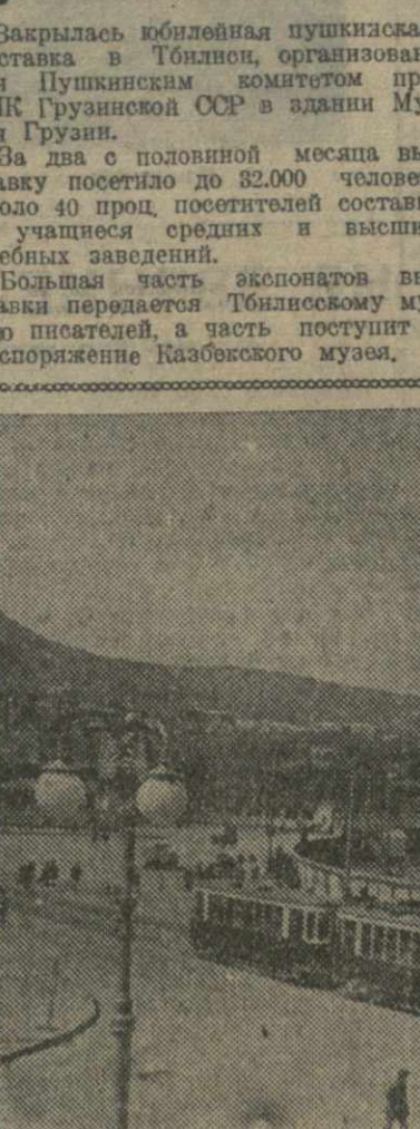
Тбилиси. Площадь Героев Советского Союза. Справа — строительство нового жилищного комбината.