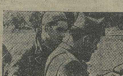
Командир республиканских войск передает через связиста приказ о наступлении.