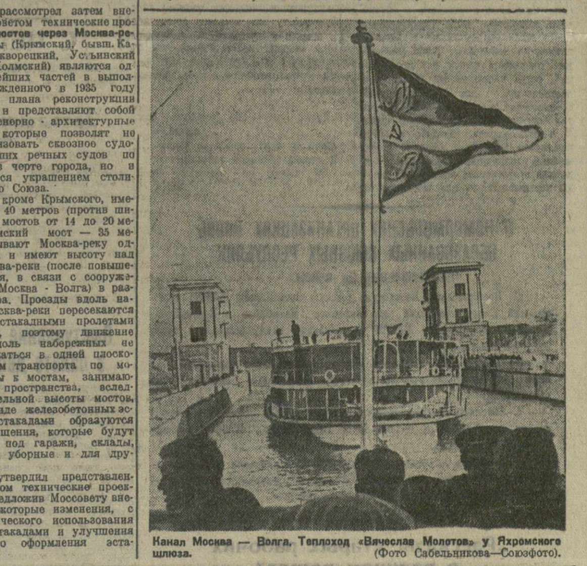
Канал Москва — Волга. Теплоход «Высшая Молотов» у Гиромского шлюза.