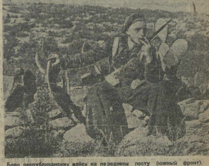
Бои республиканских войск на передовом посту (южный фронт).

ПАРИЖ, 9. (ТА). «Юманите» подала сообщение на Дюссельдорфе об инциденте, происшедшем на местном машиностроительном заводе «Нисс-Дорфман». На этом заводе германского станка по заказу СССР. Когда советская приемочная комиссия прибыла в механический цех, она заметила там экземпляры антифашистского плаката германской фашистской партии. Комиссия немедленно покинула завод. За ней поспешили генеральный директор и другие руководители завода, чтобы