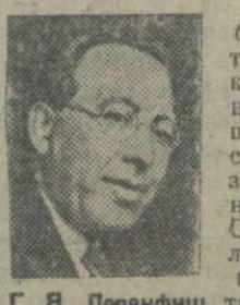
Г. Я. Левенфиш.

Вчера в перерывном до отказа концертном зале театра имени Руставели проходил последний тур X Всесоюзного шахматного чемпионата.