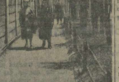
Кутавская швейная фабрика им. Кирова проводит работы по озеленению своей территории.