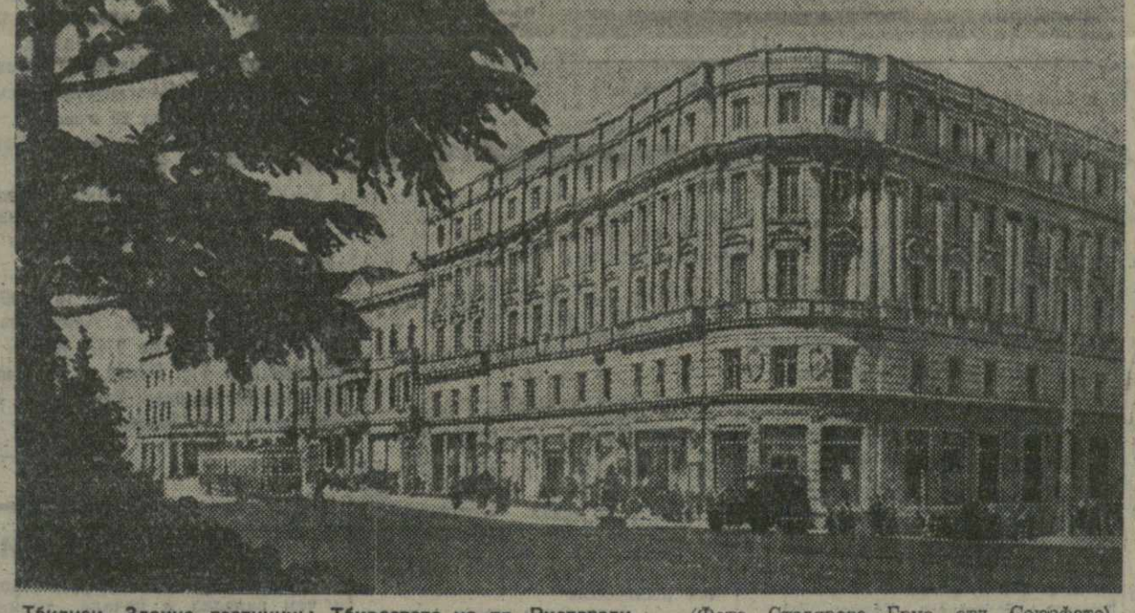
Тбилиси. Здание гостиницы Тбилиссвета на пр. Руставели.

Четыре симфонических концерта — показатель вполне заслуженного успеха дирижера у тбилисской аудитории. Оркестр в концертах Сенкара был безупречным во всех отношениях.