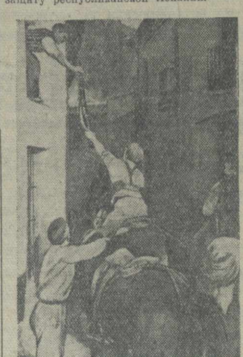
Испанский народ принимает активное участие в борьбе против фашистских мятежников и итапо-германских интервентов. В сельских местностях население организует отряды самообороны и с оружием в руках защищает свои жилища.

Приказ родины — не уступать иностранцам захваченной им части испанской земли — республиканцы выполняют в своем стремлении добиться в новом году победы над интервентами, встал на защиту республиканской Испании.