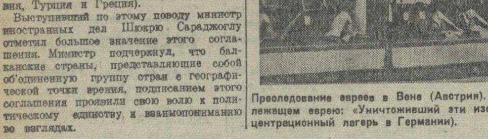
Преодоление зерн в Вене (Австрия). На снимке: надпись на магазине, принадлежащем верно: «Уничтожиши эти изображения попадет в Дахау» (Дахау — концентрационный лагерь в Германии).