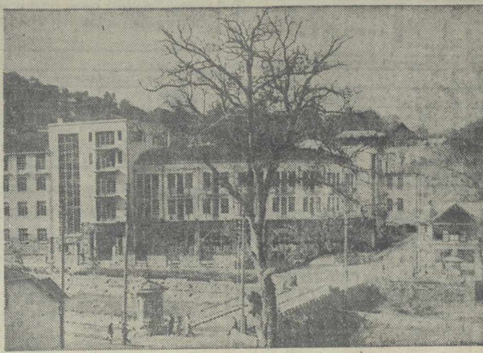
Боржом. Новая гостиница Курортного управления Грузии.

ных зданий к зиме. Это не так. Санатории в Боржоме можно приспособить к зиме. Для этого необходимо только отопить их. Боржомское курортное управление намечало в этом году установить паровое отопление в санатории № 1, однако, нехватка средств не позволила реализовать это начинание. Круглогодичная работа боржомских санаториев, помимо всего прочего, оводорова была бы финансово полезна курорту, а также бы новые средства в кассу Главкурурпа. Управление боржомского курорта — в долгах. Вся энергия работников управления уходит на то, чтобы достать в кредит, до очередного получения денег, продукты для питания больных, размещенных в гостинице. До сих пор руководители Боржомского курортного управления не знают как бурно работать курорт в 1933 году, сколько примет больных, что будет строиться. А ведь курорт, имеющий всеобщее значение, должен благоустроиваться. То, что сделано летом этого года — лишь начало больших работ по реконструкции и благоустройству курорта. С октября после закрытия санаториев на зиму вся культурная работа на боржомском курорте была свернута. В парке Мянвода — пусто... Между тем, жители в Боржоме могли бы быть включены, если бы Главкурорп организовал круглогодичную работу курорта. Д. РЫМОВ.