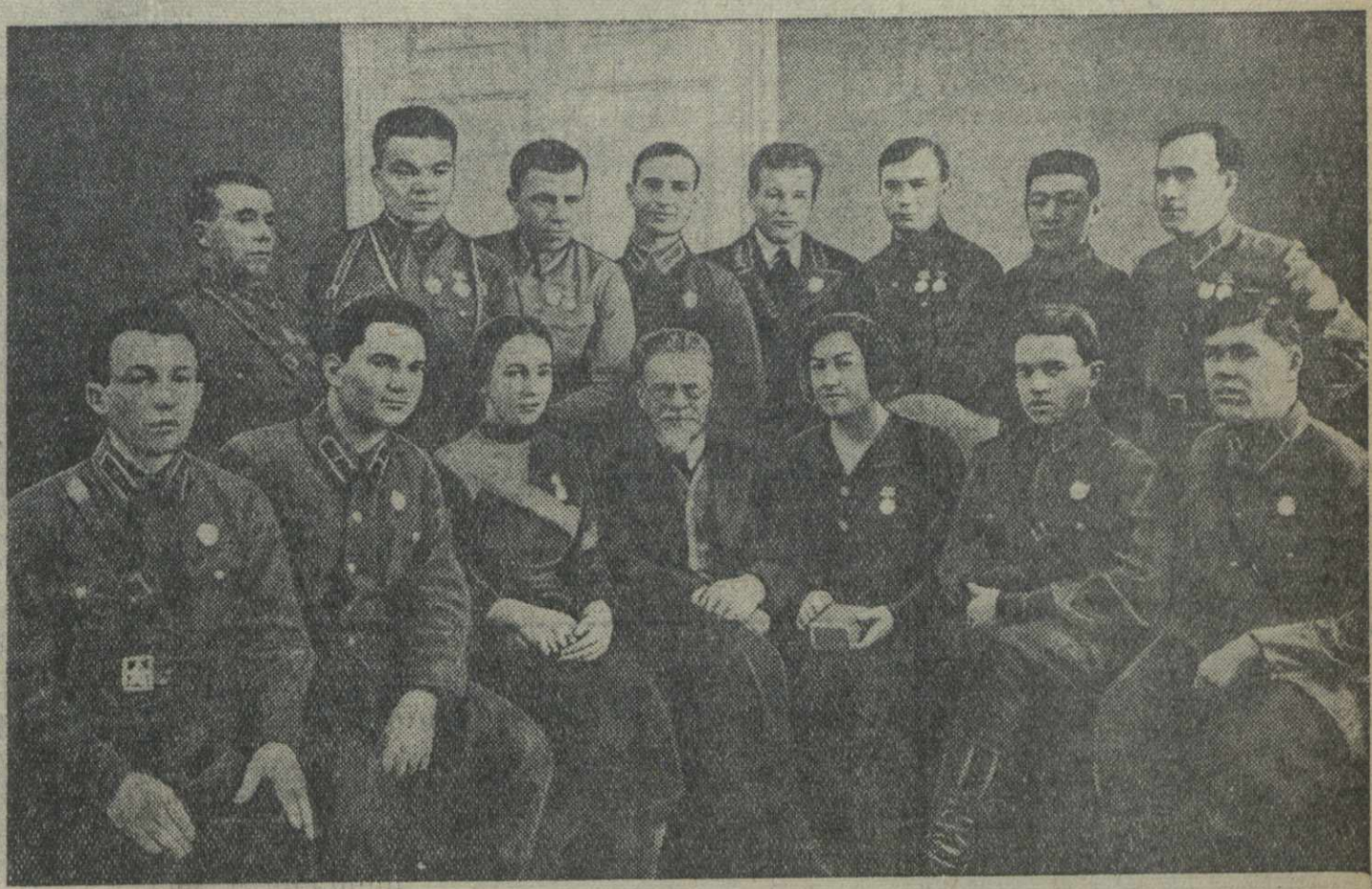
27 декабря в Кремле, в присутствии членов Президиума Верховного Совета СССР, Председателя Президиума Верховного Совета СССР М. И. Калинина были вручены ордена Союза ССР участникам боя в районе озера Хасан и др.

Делегация братских республик, участвовавшая в празднествах в Минске, посвященных 20-летию БССР, возвращаются домой. За время пребывания в столице Советской Белоруссии они посетили фабрики, заводы, музеи, учебные заведения, Академию наук.