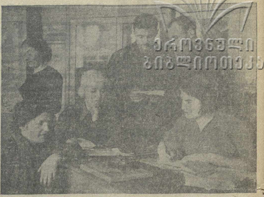
Заполнение Трудовых книжек на Шелкютканской фабрике.