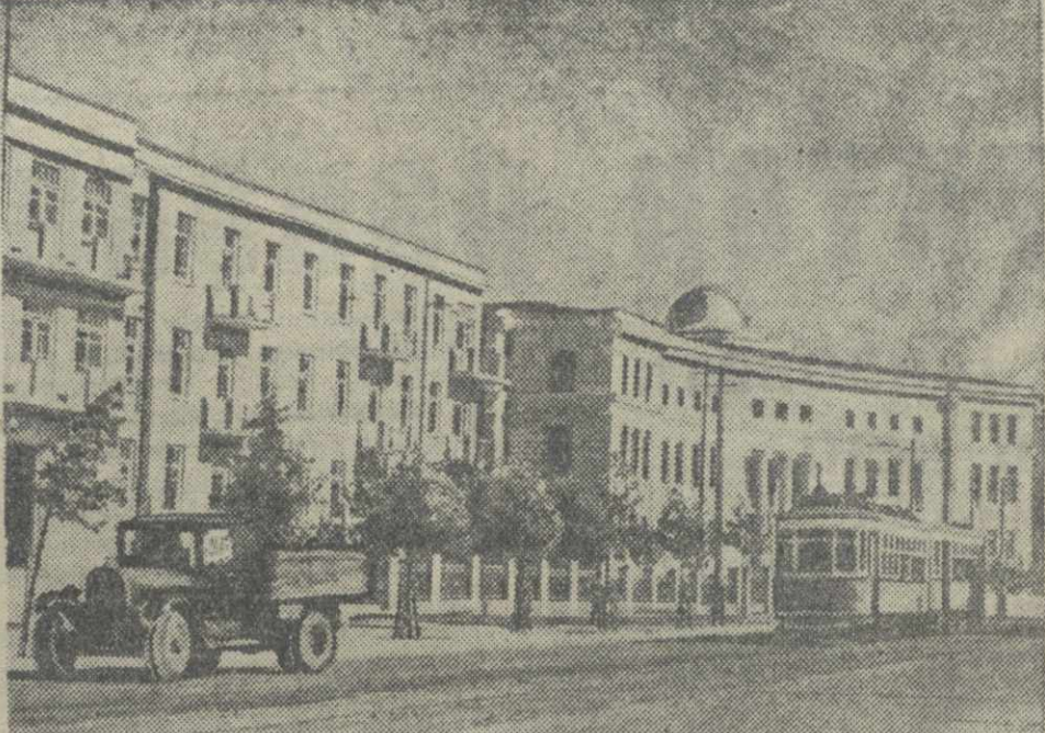
Улица Марра в Тбилиси. Фотохроника ГТА.