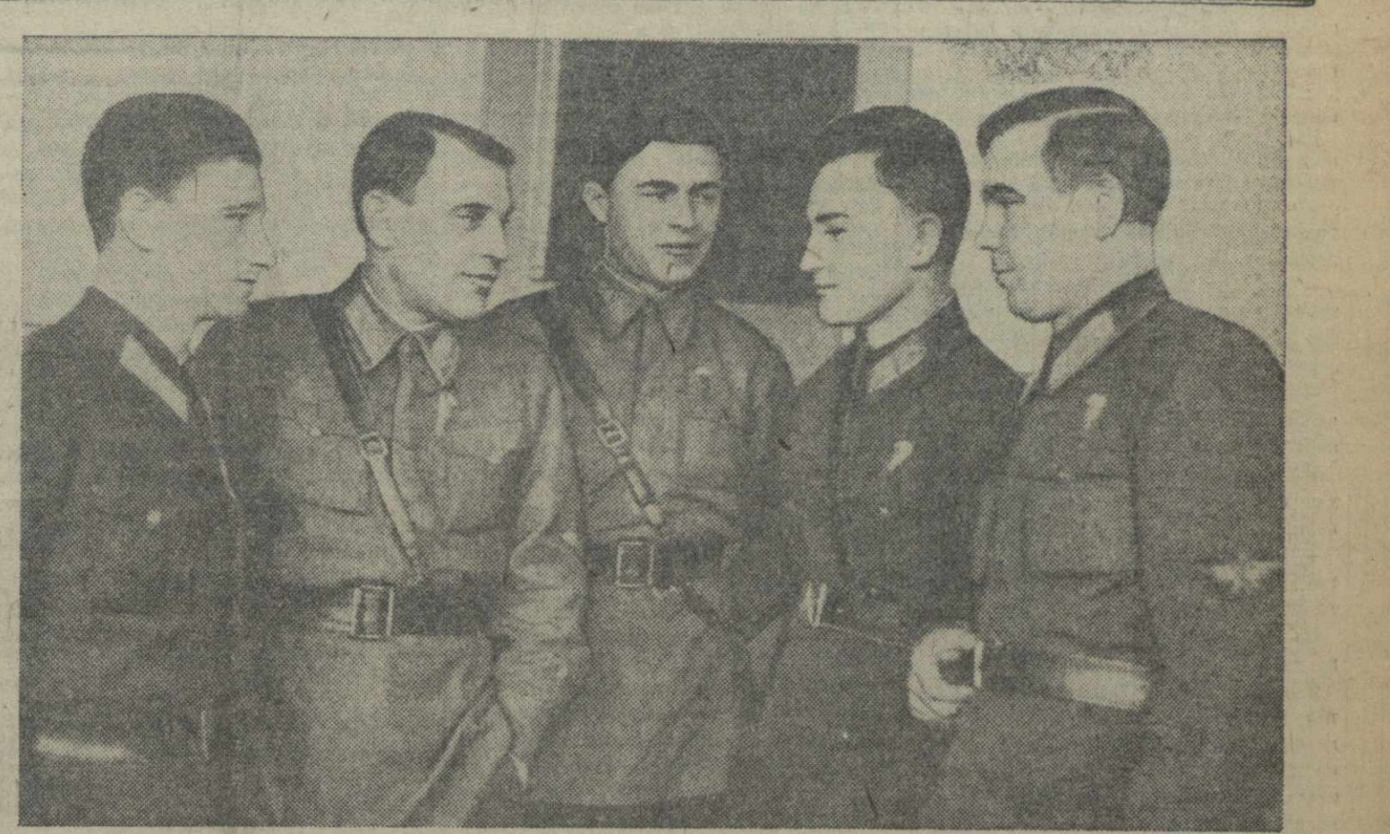
2 января в Тбилиси открылся всесоюзный учебно-методический сбор инструкторов и мастеров парашютного спорта. На сборе участвуют свыше 100 человек.

9 января вечером в Большом зале Московской государственной консерватории состоялся последний концерт 3-го Всесоюзного конкурса вокалистов.