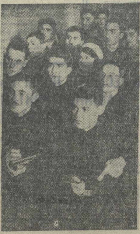
В партийном кабинете райкома имени 26 комиссаров ТО КП(б) Грузии. Комсомольский актив слушает лекцию о книге ЛЕНИНА «Что делать?».