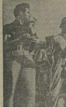
Бойцы испанской республиканской армии у зенитного орудия. (Сонзфот).