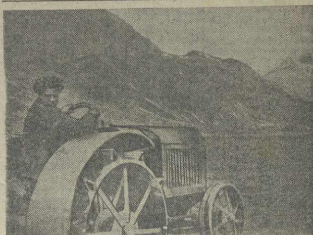
Зяблевая вспашка в Садахлинском колхозе, Борчалинского района.

МОСКВА, 1. (ТАСС). Сегодня в Большом зале консерватории состоялся вечер стахановцев-старых производственников завода «Красный богатырь», посвященный пятидесятилетию завода. 12-тысячный коллектив «Красного богатыря» пришел к 50-летию юбилею завода с большим производственным успехом. Завод 18 декабря закончил годовую план, дав стране 30 миллионов пар резиновой обуви. На вечер прибыл товарищ Калинин. Собравшиеся горячо встретили всеобщего старосту. Товарищ Калинин приветствовал краснобогаатырьев. Участники вечера послали приветствия товарищам Сталину, Калинину и Хрущеву.