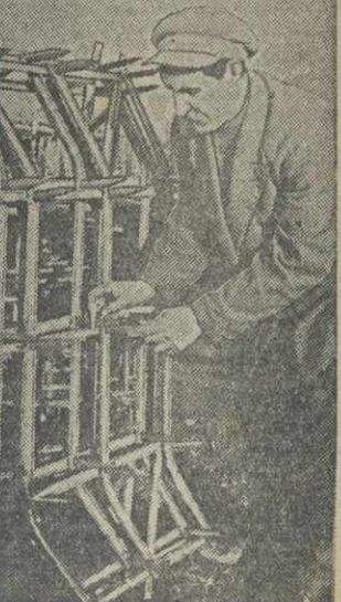
Проверка качества борон, полученных базой Грузсельхознаба для весенних работ. (Фото Будзетского. Груз. отд. Союзфото).