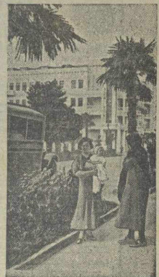
БАТУМИ. Улица Коминтерна.

Для улучшения снабжения рабочих совхозов и колхозников районов Аджарии в колхозах и совхозах открываются 27 дорожных точек. В селекции Золети открывается большой склад для снабжения товаров вновь открытых и существующих торговых точек.