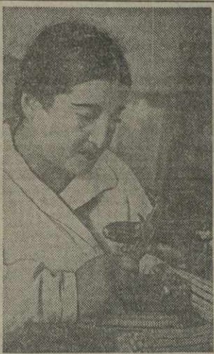
Апробация кукурузных семян для сева на контрольно-семенной станции Наркомзема Грузии.