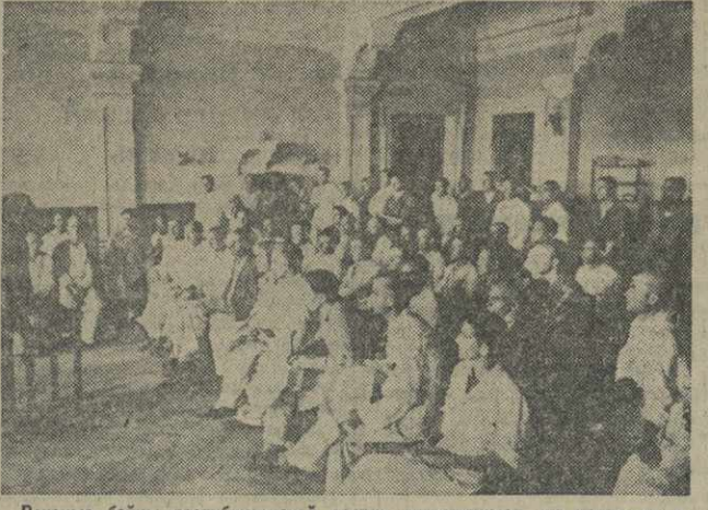
Раненые бойцы республиканской армии, находящиеся на излечении в госпитале, слушают доклад о положении на фронтах.