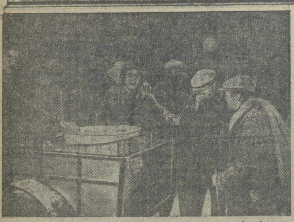
Наступившие морозы во Франции застали на улицах тысячи безработных, на некоторых прова. Они вынуждены пользоваться помощью различных благотворительных обществ. На снимке: члены благотворительного общества в Париже «помогают» безработным, выдавая каждому по чашке кофе.