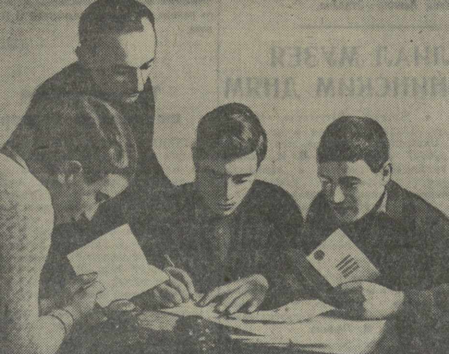
Заполнение Трудовых книжек на заводе им. Калинина.

Вот один из многочисленных фактов. Заготовительный цех никак не мог изготовить крейцшпильную масленку к отремонтированному паровозу № 8600. Для