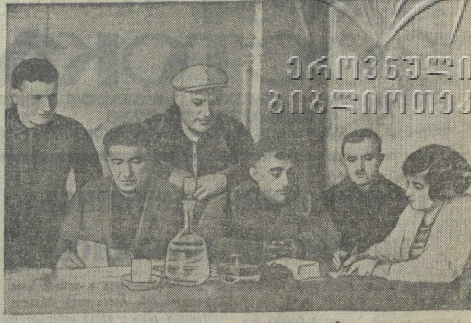
Заполнение Трудовых книжек на заводе имени Орджоникидзе.