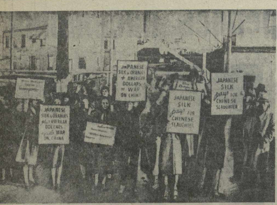
Движение за бойкот японских товаров в США. На снимке: жители гор. Сметля протестуют против разгрузки парохода, прибывшего с транспортом японских товаров. На плакатах лозунги: «Отказывайтесь покупать японские товары», «Покупка японского шелка потворствует разбою в Китае».