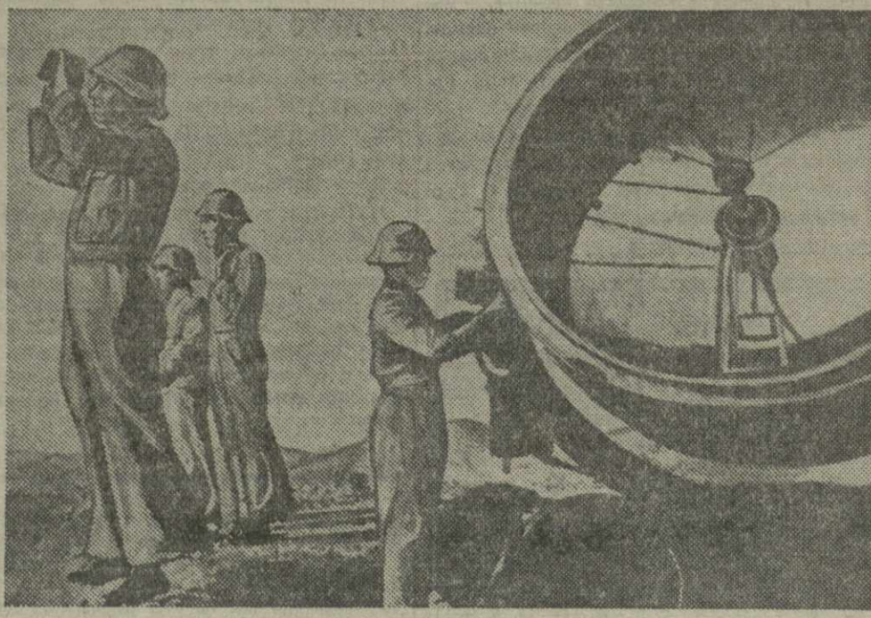
В республиканской Испании. На снимке: наблюдательный пункт противовоздушной обороны у одного из населенных пунктов Каталонии.

Тбилисский орден ЛЕНИНА гостевая ОПЕРА и БАЛЕТА им. З. Панашивили СЕЗОН 1938-39 ГОДА