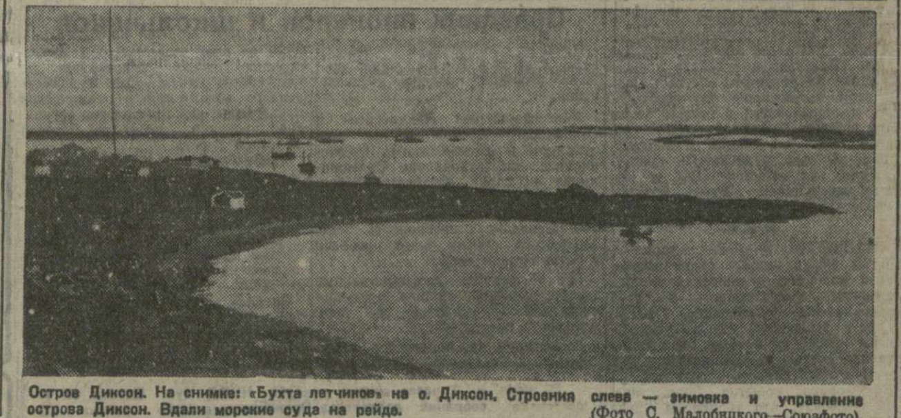
Остров Диноса. На снимке: «Бухта летчиков» на о. Диноса. Строения слева — зимовка и управление острова Диноса. Вдали морские суда на рейде.