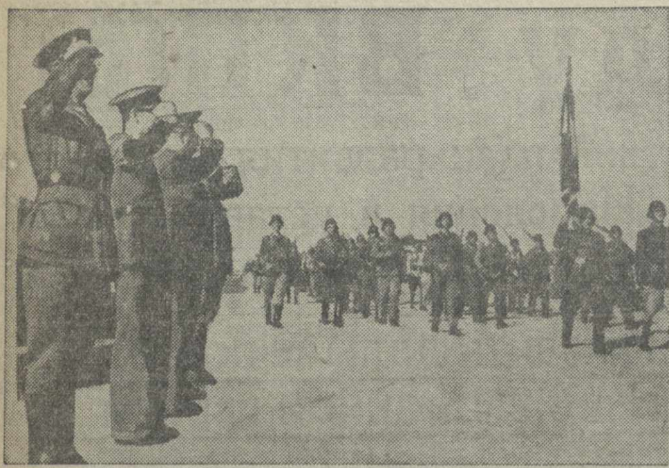
Парад бойцов республиканской армии на острове Менорка (один из островов Баlearской группы, принадлежащий республиканской Испании).