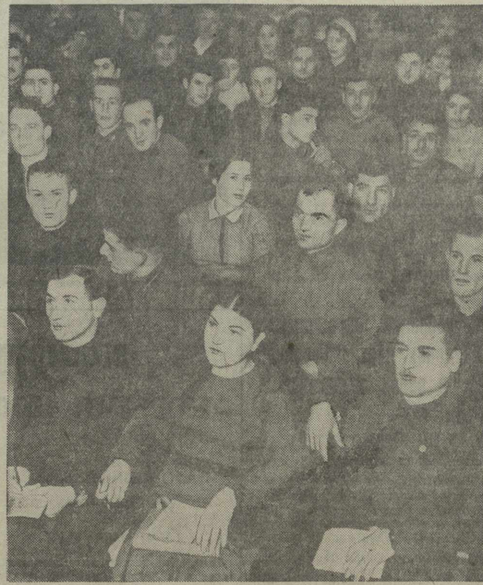
На XXI тбилисской городской конференции комсомола. Делегаты конференции в зале заседаний.