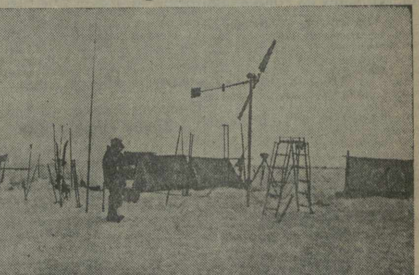
Палатки и метеорологические приборы советской станции на дрейфующей льдине. (Союзфото).