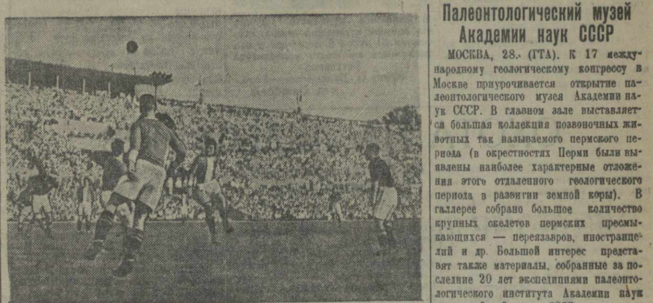
Футбольный матч между сборной командой Страны Басков (Испания) и командой общества «Локомотив». На снимке: момент игры.

Общий интерес представлял доклад проф. Збарского «Вопросы питания в работах комитета гигиены Лиги наций».