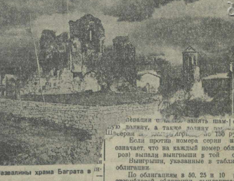
Развалины храма Баграта в долине Шаверды