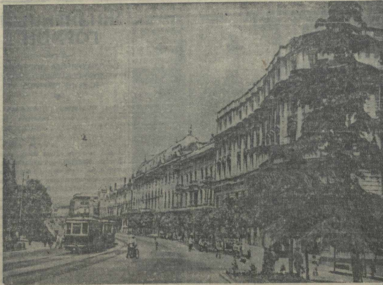
ТБИЛИСИ. Проспект Руатавели.

Подписка на заем в районах продолжается, охватывая все большее количество колхозников, рабочих и служащих, встретивших выпуск займа обороны с большим энтузиазмом.