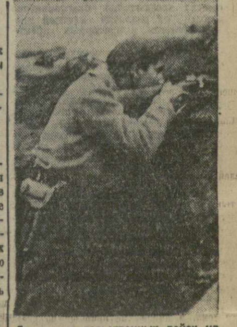
Боец правительственных войск на мадридском фронте. (Сюжет фото.)

ПАРИЖ, 3 (ТА). Полпред СССР в Париже тов. Суриц сегодня посетил председателя совета министров Шотана, а также министра иностранных дел Дельбоса.