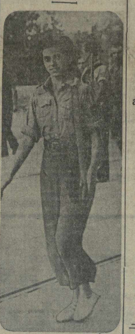
Девушка-доброволец испанской республиканской армии.

Постановление Центрального Исполнительного Комитета СССР Центральный Исполнительный Комитет СССР постановляет: За образцовое выполнение специальных заданий правительства по укреплению оборонной мощи Советского Союза и проявленный в этом деле героизм присвоить звание Героя Советского Союза со вручением ордена Ленина: 1. Командиру Пумпуру Петру Ивановичу, 2. Командиру Колосникову Константину Ильичу, 3. Ст. лейтенанту Денисову Сергею Прокофьевичу, 4. Лейтенанту Хоановскому Ивану Андреевичу, 5. Младшему командиру Новикову Василию Михайловичу, 6. Младшему командиру Билибину Вязьме Яковлевичу. Председатель Центрального Исполнительного Комитета СССР М. КАЛИНИН. За секретаря Центрального Исполнительного Комитета СССР — член Президиума ЦИК СССР Н. ФИЛАТОВ. Москва, Кремль, 4 июля 1937 года.