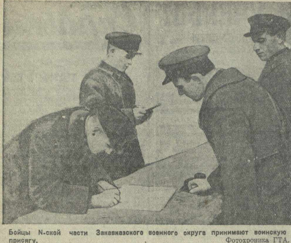
Бойцы N-ской части Закавказского военного округа принимают воинскую присягу.