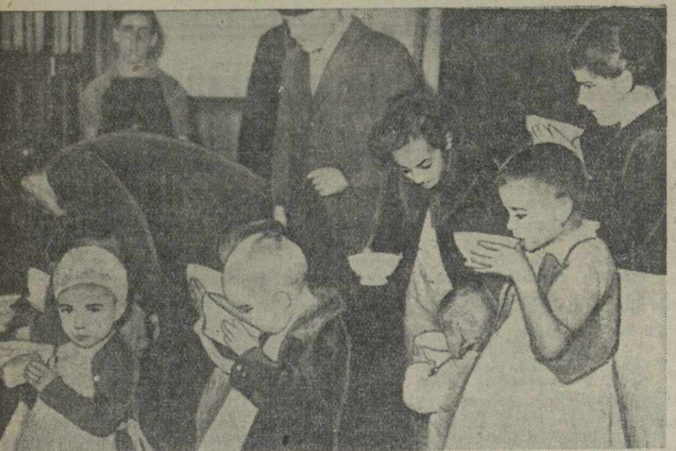
Французское население с огромной симпатией относится к беженцам из Каталонии. На снимке: представители рабочих организаций Франции раздают молоко детям испанских беженцев.

В северной части провинции Циансю японцы продолжают попытки «очистить» от партизан восточный сектор Луцхайской железной дороги. Упорные бои происходят неподалеку от городов Хуайань и Хайчжоу (Дунхай).