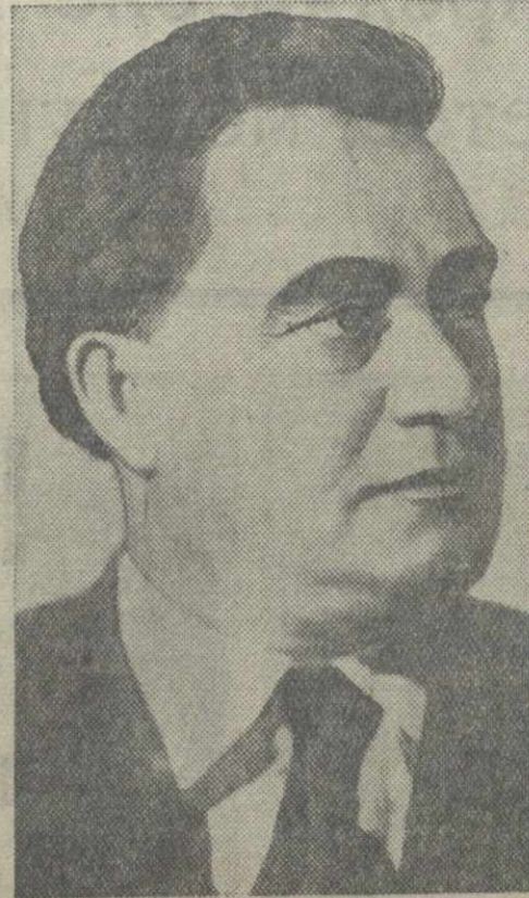
Генеральный секретарь Исполкома Коминтерна тов. Г. М. Димитров

Двадцать лет назад, 4 марта 1919 года, в Москве, на первом международном коммунистическом конгрессе был основан Третий, Коммунистический Интернационал — международный штаб революционной борьбы пролетариата. Коммунистический Интернационал был создан по инициативе партии большевиков, руководимой Лениным и Сталиным.