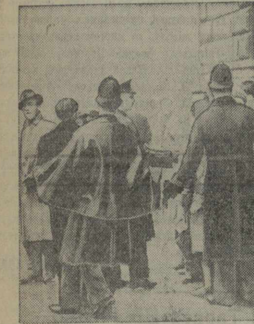
В Лондоне состоялась демонстрация солидарности с героическим испанским народом. Демонстранты требовали оказания помощи республиканской Испании и отказа от политики «немешательства».

Пачелли, выполнявший функцию министра иностранных дел при прежнем папе Пие XI и являвшегося главным политическим советником папы.