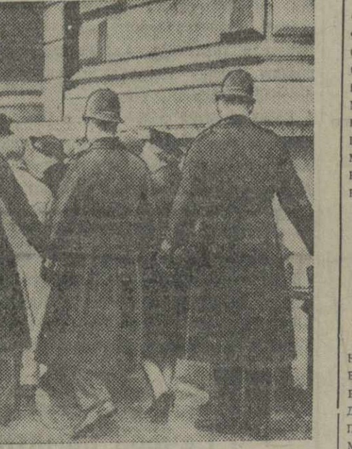
В Лондоне состоялась демонстрация солидарности с героическим испанским народом. Демонстранты требовали оказания помощи республиканской Испании и отказа от политики «немешательства».