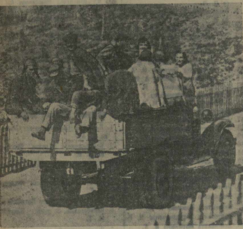
Колхозников, живущих на окраине села Байсубубани, доставил на собрание принадлежащий колхозу грузовик.