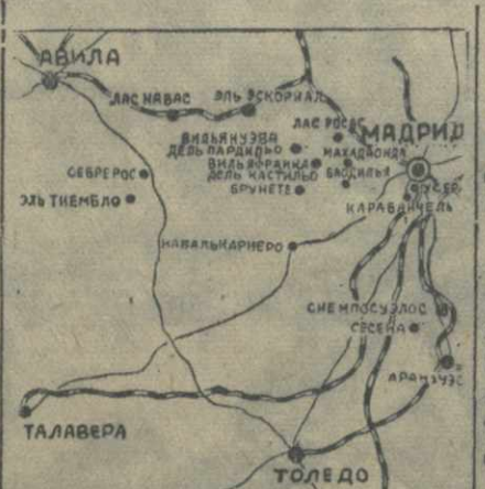
16 июля авиация республиканцев совершила ряд разведывательных полетов в тылу противника и бомбардировала некоторые из аэродромов мятежников. Успешно осуществлена эта операция, республиканские самолеты благополучно вернулись обратно.

Негритянский писатель Юз Лангстон в своей речи подчеркнул, что в Америке еще сильна старая расовая предрассудки. Американские негры, подвергаются преследованиям