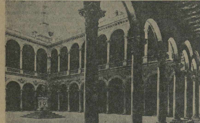
Дворцы Альказара в Толедо (XVI век), варварски разрушенные фашистскими мятежниками и интервентами.

Последние сообщения, республиканцы ведут наступление на деревню Лас Росас и Вильяфранка дель Кастильо. После ожесточенных боев республи-