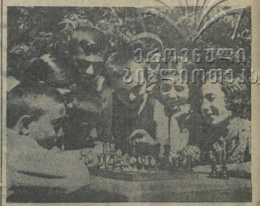
В парке культуры и отдыха им. С. Орджоникидзе. На снимке: игра в шахматы на детской площадке.

Обязательства англо-советского морского соглашения не распространяются на морские силы СССР на Дальнем Востоке ни в отношении качественных ограничений, ни в отношении обязательств сообщения с этими силами.