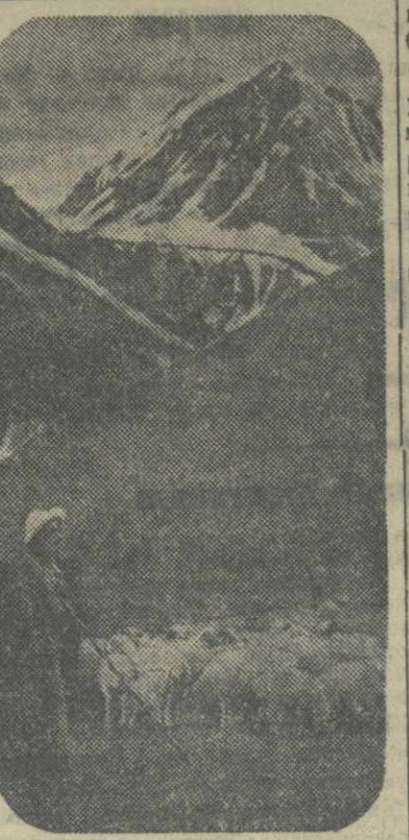
На летних пастбищах в Назбегском районе.

1 августа из Тбилиси выезжает группа студентов V курса географического факультета Госунта в составе тт. Тугуши, Оболадзе, Квацехелиа и др. В заданию группы входит исследование по четвертичной геологии и геоморфологии Тушетии и восхождения на вершины Пиринкитского хребта, не посещавшие альпинистами уже в течение 35 лет.