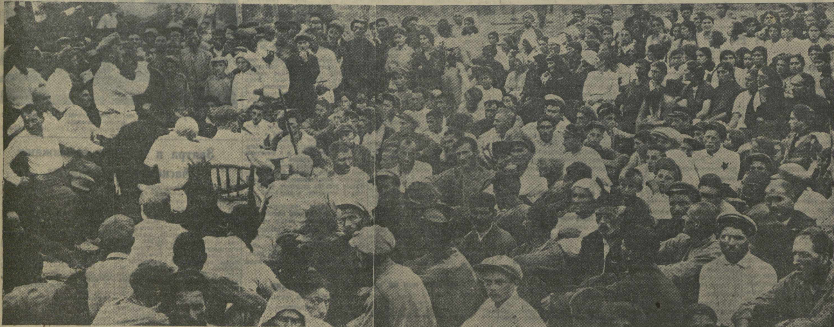
ОБЩЕЕ СОБРАНИЕ БАЙСУБАНСКИХ КОЛХОЗНИКОВ, ПОСВЯЩЕННОЕ ОБСУЖДЕНИЮ НОВОГО ИЗБИРАТЕЛЬНОГО ЗАКОНА.