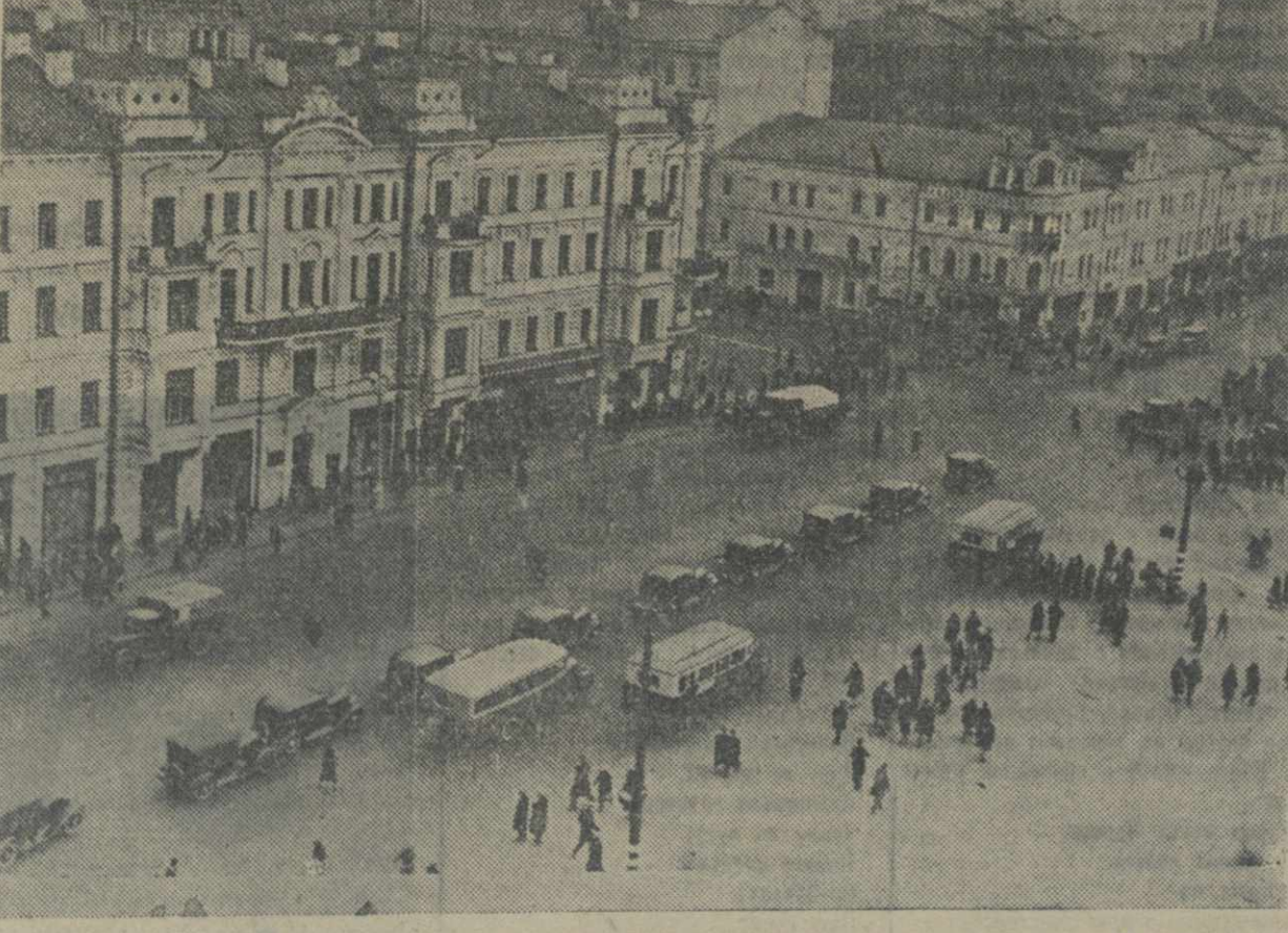
МОСКВА. На снимке: Площадь Маяковского.

В 1870 г. был поставлен вопрос о постройке водопровода взамен старого, обветшалого к этому времени. Был приглашен инженер Генох из Германии. Его заключение маршировало 7 лет, и лишь в 1877 г. было приступлено к исполнению. В 1882 г. проект устройства водопровода рассматривался Русским техническим обществом. В 1883 г. было приступлено к составлению нового проекта и опять были приглашены иностранные инженеры. В 1887-1888 гг. был принят проект Мытищинского водопровода. Новый Мытищинский