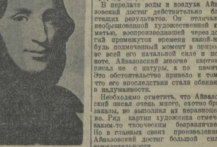
И. К. Айвазовский (Репродукция из портрета работы худ. Тыранова, Третьяковская галерея).

Со времени основания петербургской Академии художеств русская живопись утратила свое оригинальное лицо и приобрела новое направление.