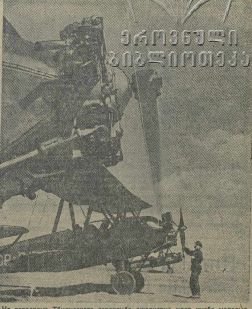
На аэродроме Тбилисского аэроклуба ежедневно идет учеба молодых пилотов, осваивающих летное дело без отрыва от производства.

Мастера тбилисского «Динамо», которые в основном составляют сборную команду Грузии, в течение двух последних дней заняты усиленной тренировкой.