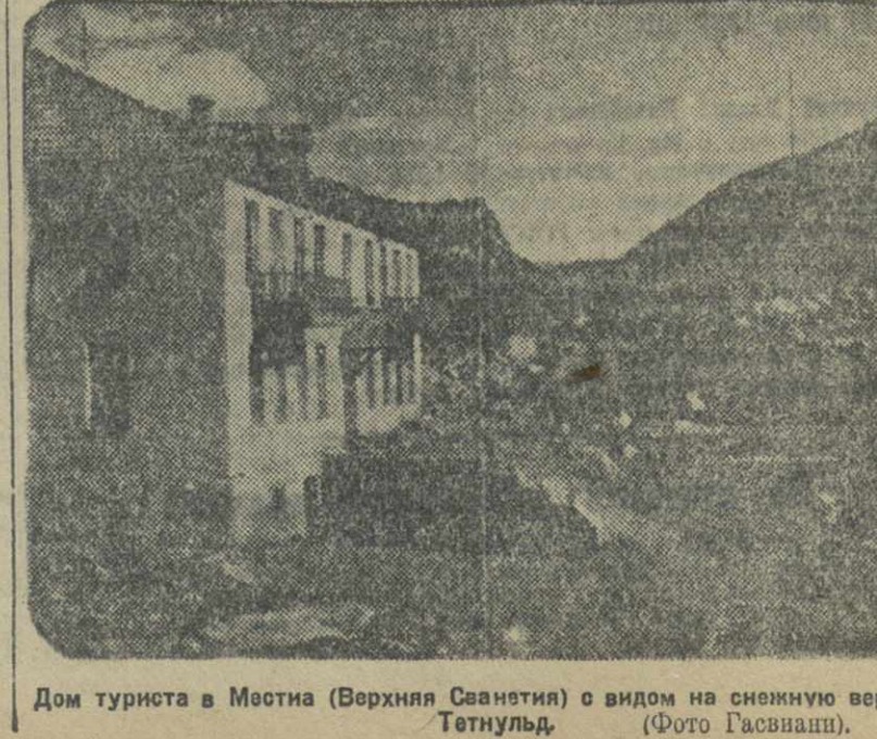
Дом туриста в Местна (Верхняя Сванетия) с видом на снежную вершину Тетнульд.