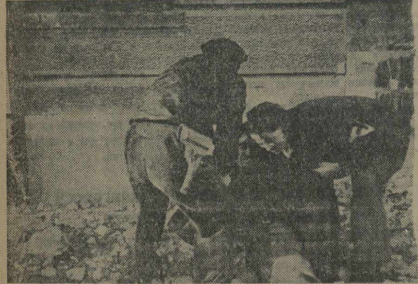
Бои правительственных войск выносят раненого товарища с линии огня.

НА ВОСТОЧНОМ ФРОНТЕ (аргоном) мятежники продолжают оказывать давление на правительственные войска в районе к западу от Теруэла.