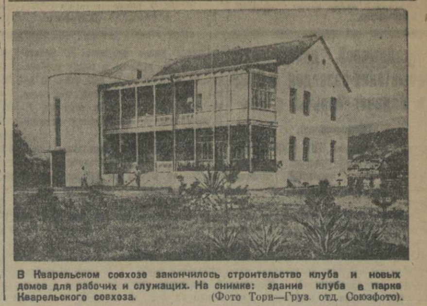
В Кварельском союзе закончилось строительство клуба и новых домов для рабочих и служащих. На снимке: здание клуба в парке Кварельского союза.