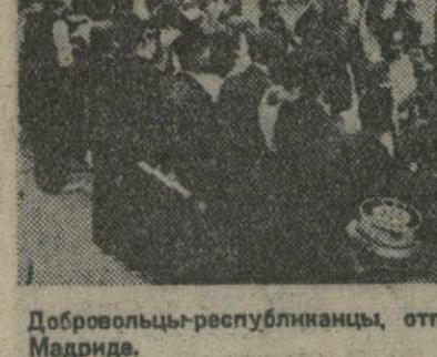
Добровольцы-республиканцы, отправляющиеся на сборный пункт в Мадриде.

Как передает агентство «Ассошиэйтэд прес» из Вашингтона, на заседании правительства США обсуждалось событие в Китае. После заседания один из членов правительства заявил представителям печати, что по его сведениям, в крейсер «Августа» попал японский снаряд.