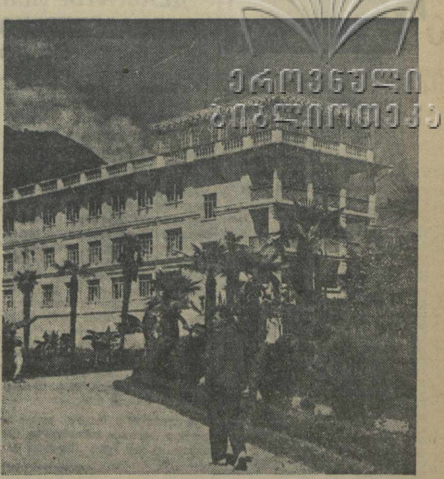
Псырца. Санаторий «Абхазия».