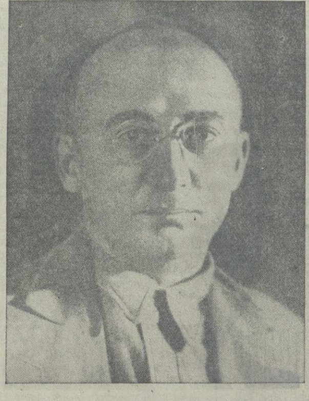
Товарищ Сталин в своем докладе подвел итоги всемирно-исторических побед социализма...