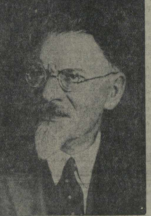
М. И. КАЛИНИН