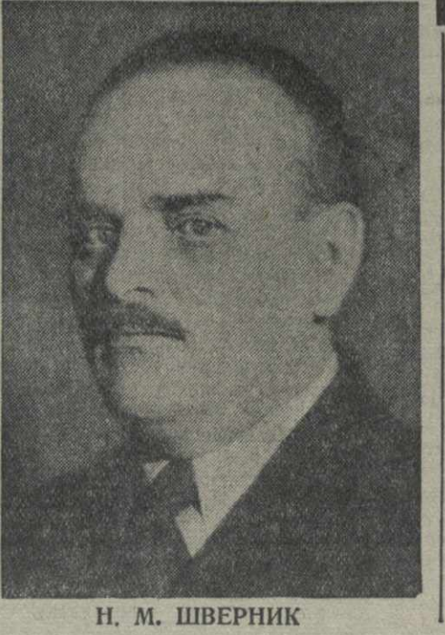
Н. М. ШВЕРНИК