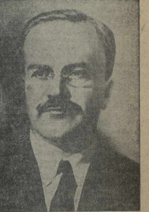
В. М. МОЛОТОВ