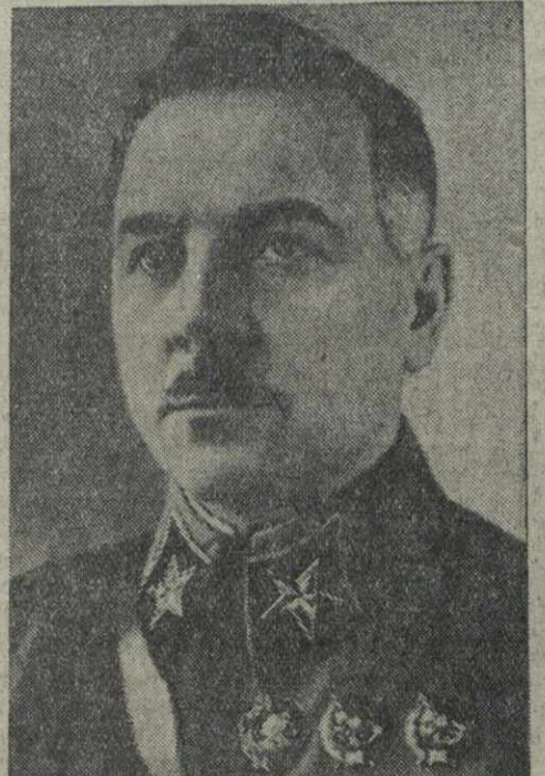
К. Е. ВОРОШИЛОВ