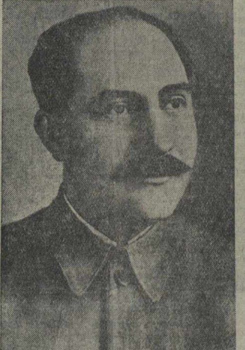
Л. М. КАГАНОВИЧ