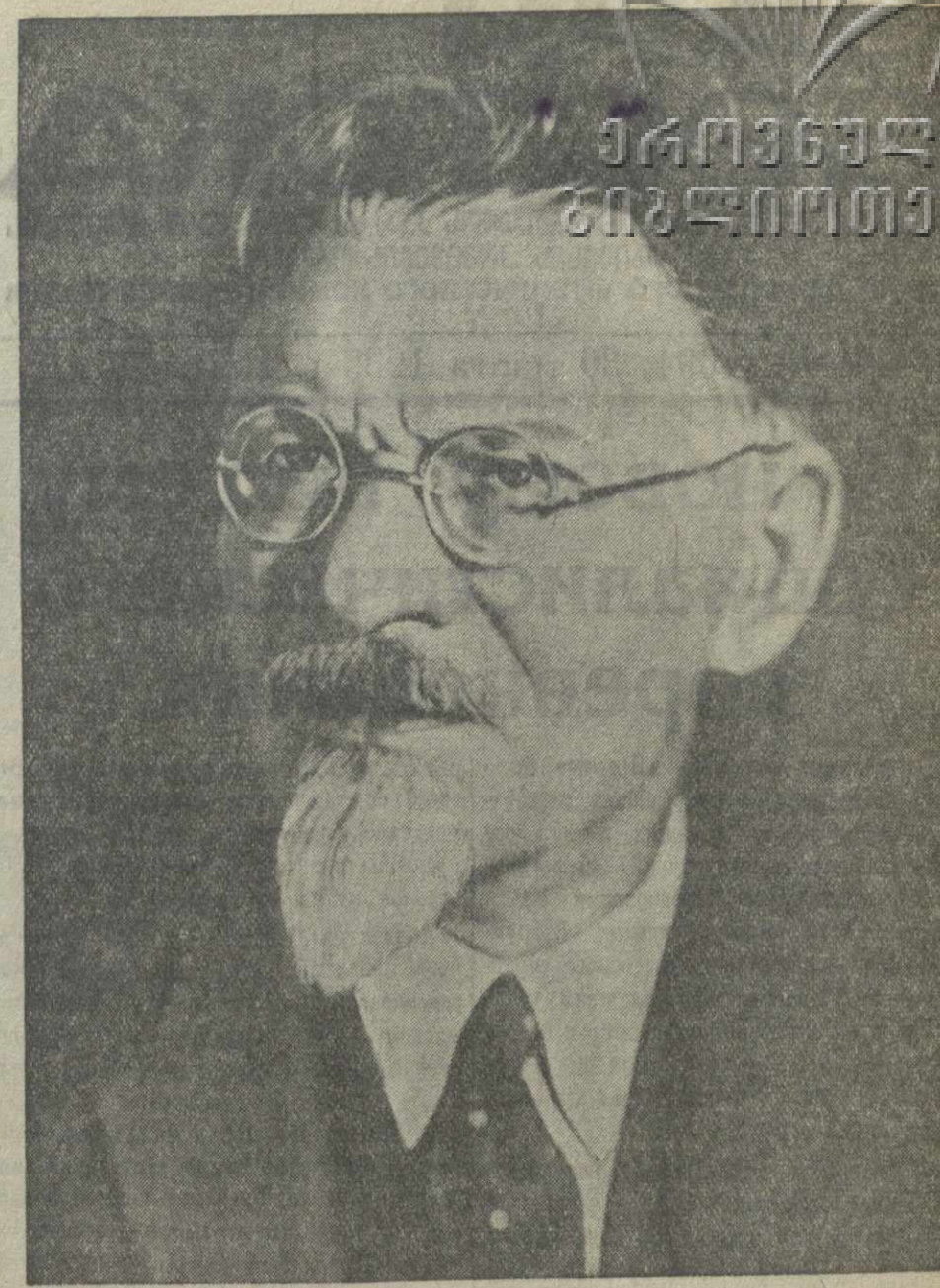
М. И. КАЛИНИН Председатель Президиума Верховного Совета СССР