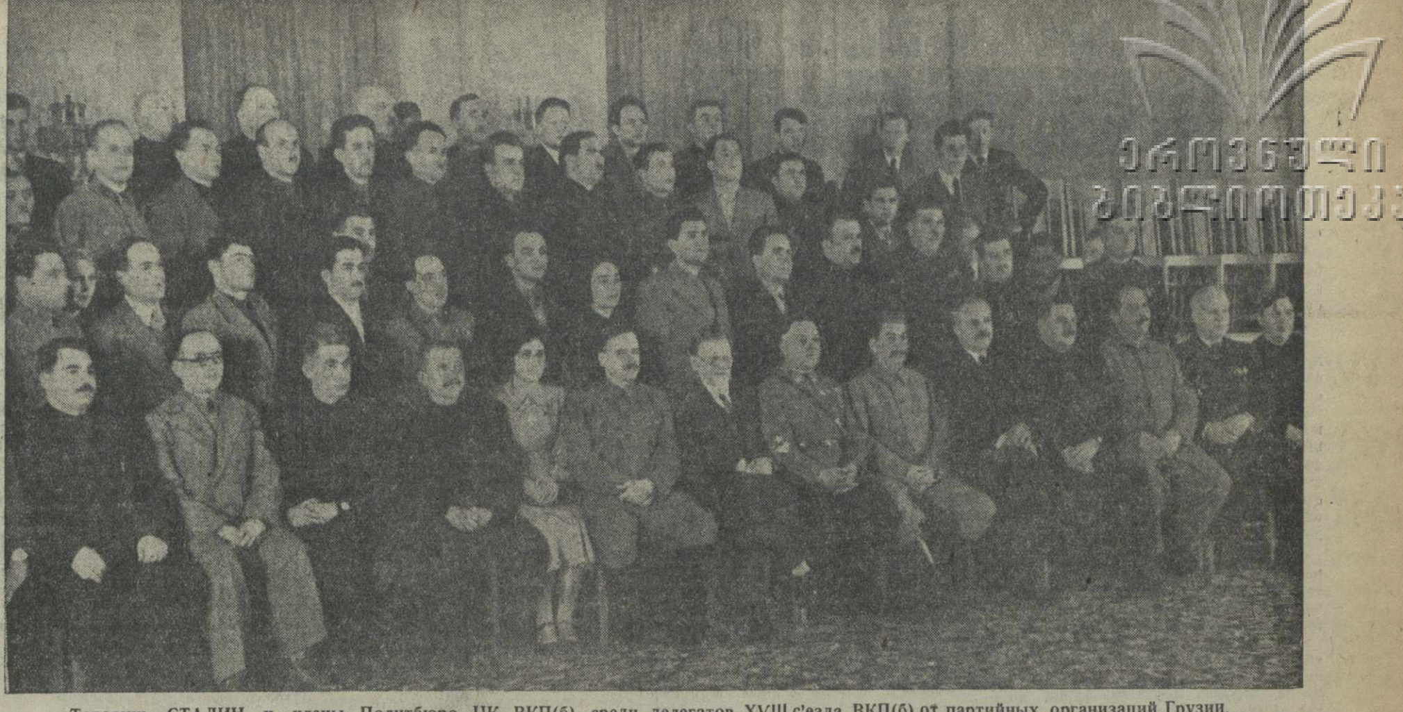
Товарищ СТАЛИН и члены Политбюро ЦК ВКП(б) среди делегатов XVIII с'езда ВКП(б) от партийных организаций Грузии. Фотохроника ТАСС.

Советский народ это прекрасно понимает. И потому он отвечает на решение XVIII с'езда ВКП(б) новым взлетом соревнования, дальнейшим развитием стачановского движения, стремлением добиться коллективных достижений замечательно и письмо работников «Красного пролетария»: они берутся к 1 мая лить сверхплана восемьдесят стачков, закончить годовую программу всего завода досрочно, к 12 декабря этого везла достигнуть только рекордами олимпийцев. Этого можно добиться правильной организацией труда всех или хотя бы большинства рабочих