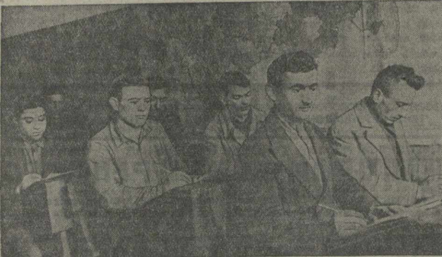
Группа слушателей школы мастеров социалистического труда, организованной при тбилисском паровозо-вагоноремонтном заводе имени СТАЛИНА.