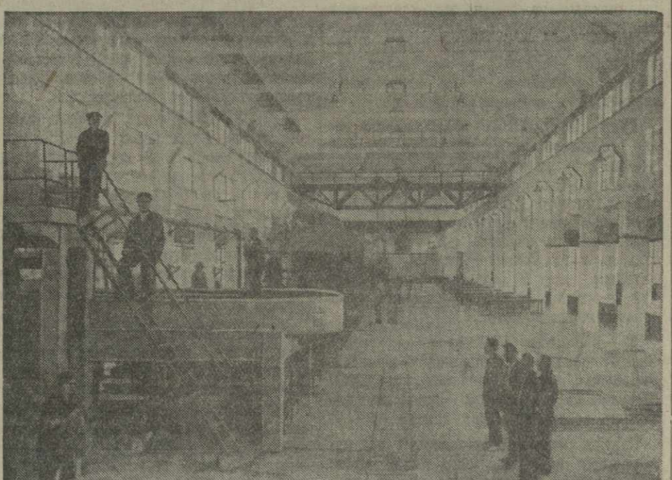
С каждым днем увеличивается выпуск бумаги перенос комбинатами Грузии, пущенный в первом году третьей стальной пятилетки. — Ингурийский бума- но-целлюлозный комбинат. На снимке: бумажный зал комбината.