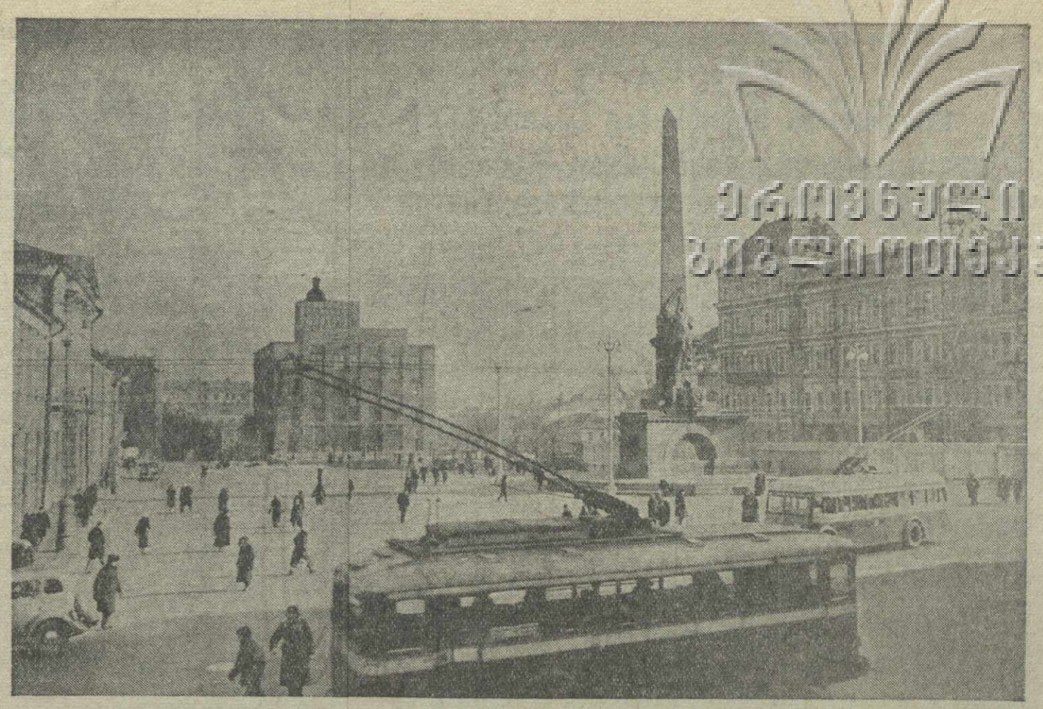
Москва. Советская площадь.

Вы, товарищ Сталин, во весь рост поставили основную задачу — догнать и перегнать в ближайшие две-три пяти-