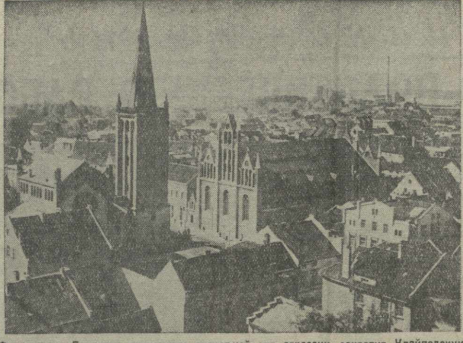
Фашистская Германия совершила очередной акт агрессии, захватив Клайпедскую область, принадлежавшую Литве. На снимке: общий вид г. Клайпеды.