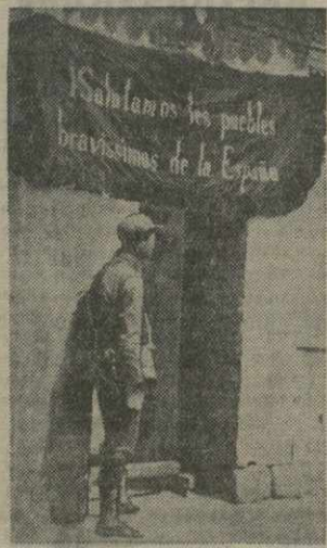
Лозунг на испанском языке, вывешенный над домом одного из городов Северного Китая: «Мы приветствуем храбрый народ Испании».

Английское правительство, добавляет газета, просило итальянское правительство представить информацию относительно заявления испанского правительства, в котором утверждалось, что генерал Франко получил в свое распоряжение несколько итальянских военных судов.