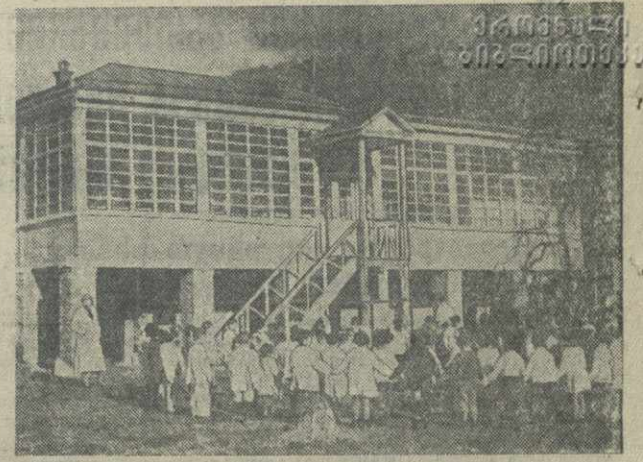
В Лагодехи открылся новый детский очаг, обслуживающий детей рабочих и служащих ферментационного завода и лагодехских колхозников. На снимке: здание детского очага в Лагодехи.

Кабинет истории ВКП(б) — консультация на тему: «Партия большевиков в годы подъема рабочего движения перед первой империалистической войной (1912—1914 гг.)» — на русском языке. Начало в 7 час. вечера.