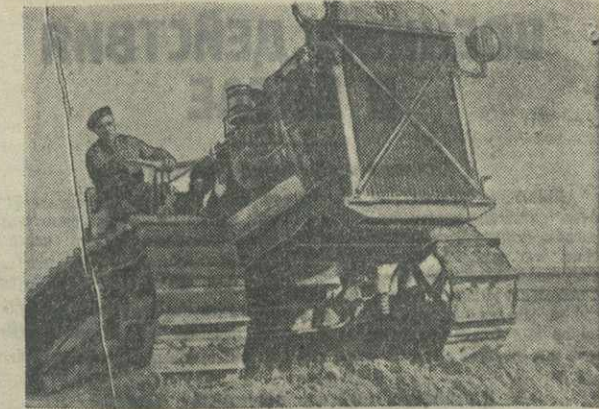
Обкатка отремонтированного трактора «ЧТЗ» в Цхинвальской МТС.