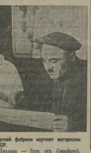
Агитаторы первой Тбилисской кондитерской фабрики изучают материалы работы I Сессии Верховного Совета СССР.