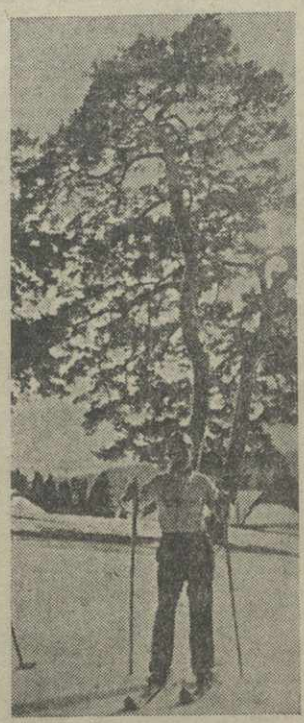
Зимний день в Манглиси. На лыжной прогулке. (Фото Рышкова — Груз. отд. Союзфото).

За последнее время наблюдаются случаи, когда домоуправления наклеивают желтые снимки в определенные фотографии. Паспортный отдел милиции разясняет, что гражданам предоставляется право сниматься там, где это им наиболее удобно.