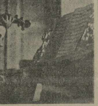
Зимний день в Манглиси. На лыжной прогулке.

В многочисленных отделах Дворца дети будут развлекаться, заниматься спортом, развивать свои художественные наклонности, накапливать полезные знания.