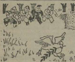
Голубь мира. — Не принимают ли они меня за новогоднего гуса? «Юманите», Париж.

Орган английской компартии «Дейли уоркер» указывает, что треногий британской буржуазии по поводу уменьшения народонаселения обеспокоены тем, что «для новых войн нужны солдаты».