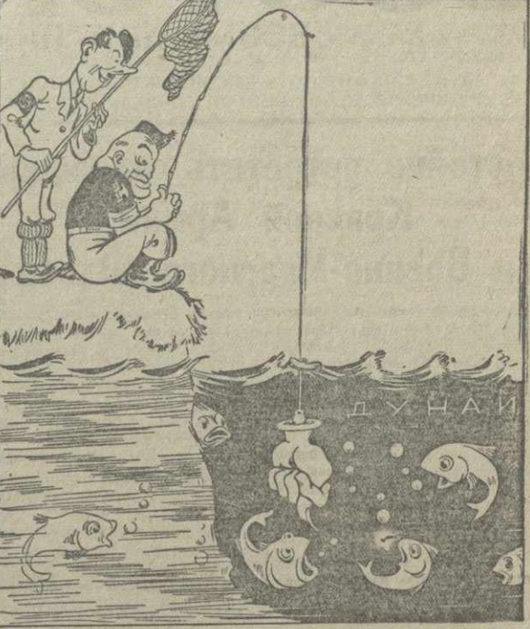
Рис. И. Гурро.

Блок агрессоров настойчиво «убеждает» выйти из Лиги Наций. Доводом служит даже не обострение каких-либо выгод, а одно голое утверждение, что они от «этого ничего не потеряют».