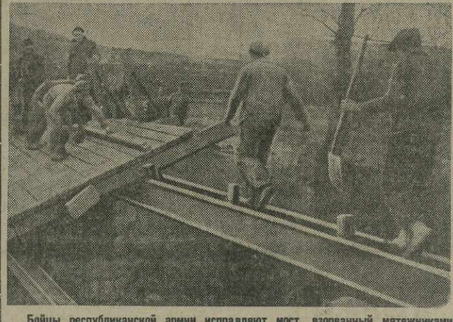
Бойцы республиканской армии исправляют мост, взорванный мятежниками.

★ Сегодня, в 8 часов вечера, в Дворце писателей Грузии (ул. Мачабели, 13) состоится занятие русского литературного кружка.