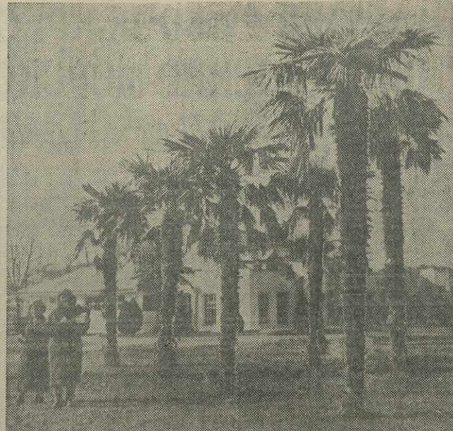
Курорт Цхалтубо. В пальмовом сквере в зимний день.

БАКУ, (ТАСС). На Каспийском море открылась навигация. 11 февраля флагман Каспийского нефтяного танкера «Ленин», груженный 9 тысячами тонн керосина, поднял красный вымпел и взял курс на Астрахань.