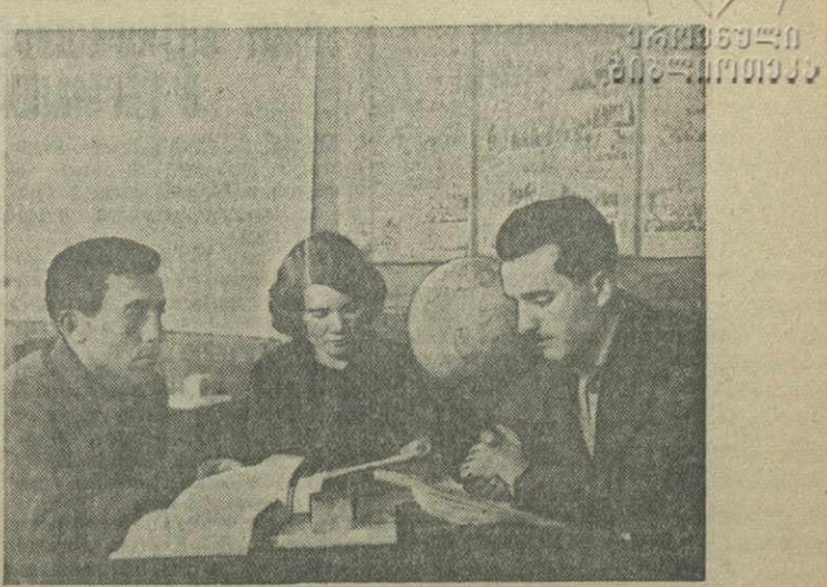
Агитаторы — комсомольцы Тбилисской обувной фабрики в парткабинете фабрики готовятся к очередному политзанятию.