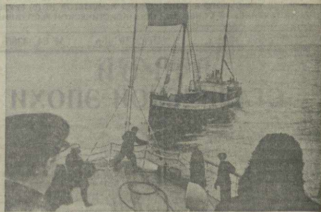
Ледокол «Ермак» берет на буксир «Мурманск» в открытом море.