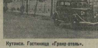
Кутайси. Гостиница «Гранд-отель». (Фото В. Полякова).

В ближайшие дни дети, принятые в группу, приступят к занятиям.