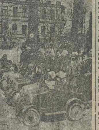
В Тбилисском парке культуры и отдыха пионеров и школьников. «Колонна пробага» перед стартом.