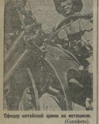
Офицер китайской армии на мотоцикле.

Нотисше шесть месяцев антиимпериалистической борьбы обогатили опыт китайского народа и способствовали росту и укреплению народно-революционной армии Китая.