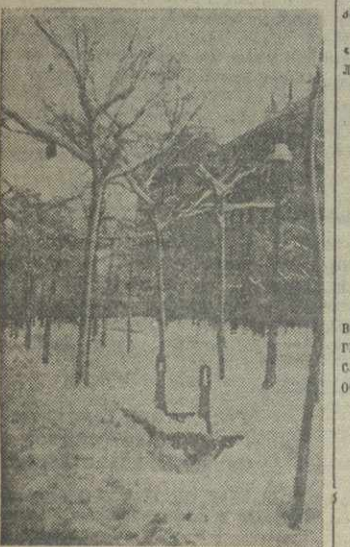
Столица республиканской Испании — Мадрид в снегу.

ЛОНДОН, 18. (ТАСС). Как сообщает агентству Рейтер, сегодня между Англией и Италией подписан новый торговый договор и соглашение о взаимных расчетах. Переговоры о заключении торгового соглашения, которые, по мнению агентства, связаны с переговорами по политическим вопросам, продолжались в течение последних шести недель.