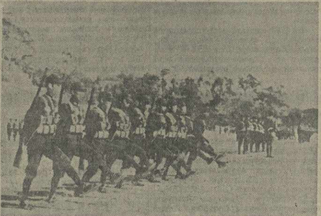
Ввод китайских новобранцев, проходящих строевую подготовку. (Союзфото).

Дипломатический корреспондент «Дейли телеграф энд Морнинг пост» подтверждает тот факт, что британское правительство произвело соответствующее заявление на Прагу в пользу Гитлера, как оно это сделало вчера в Каунасе в пользу Рыдз-Смиглы. Обозреватель заявляет, что в течение всего вчерашнего дня в английском министерстве иностранных дел и в канцелярии английского премьера происходили совещания относительно положения в Центральной Европе. Обозреватель признает, что английские министры стремятся «обеспечить наиболее благоприятное отношение в Праге к требованиям немецкого меньшинства» (читай: германских фашистов). (ТАСС).