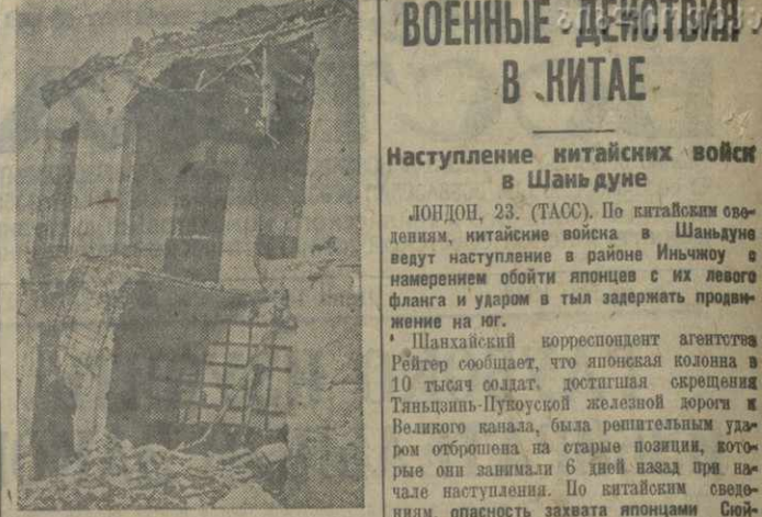
Дом, разрушенный во время бомбардировки Мадрида с фашистских самолетов.