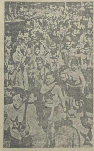
Отряд испанских пионеров на одной из улиц Мадрида.

Как уже сообщалось, финансовая комиссия сената предложила сократить требуемые правительством кредиты до 5 млрд. франков (вместо 8.145 млн. франков). Социалистический сенатор Бетуль внес контрпредложение, сводящееся к поддержке законопроекта в редакции, принятой палатой депутатов.