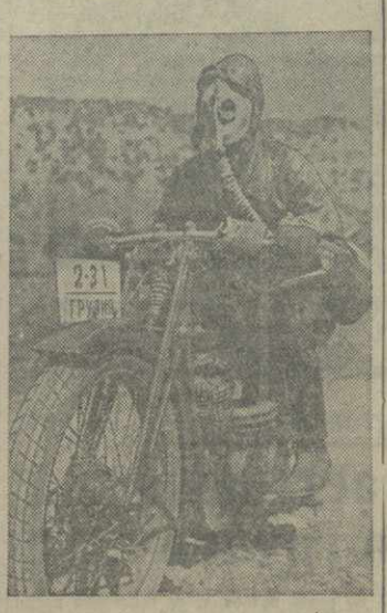
24 марта состоялся военизированный спортивный кросс Тбилиси — Мцхета — Кавтисхеви. Все участники этого кросса все время были в противозапах. На снимке: один из мотоциклистов-участников кросса..

В работах по погоне частей судна приняла участие буксирный катер «Стахановец», сокративший плавучий край и выдвинувшая станция. Со дня моря назначены главный двигатель судна, вспомогательные моторы, различные механизмы и снасти.