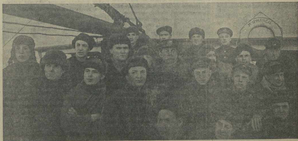
Команда парусно-моторного судна «Мурманец».

На совещании выступили тт. Минадзе (старший агроном Ахалцихского районного