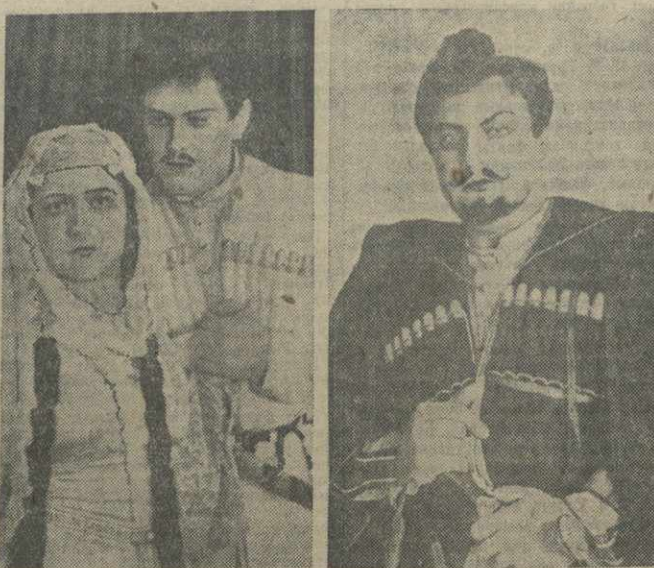
19 марта Киевский ордена Ленина театр оперы и балета показал премьеру оперы Захария Палиашвили «Даиси».

Прекрасной игрой Абрамян добился победы над своим противником Серетой и обеспечил себе первое место в турнире. По-прежнему протекала партия Сорокин — Асоевский. Асоевский в случае выигрыша делит первое место в чемпионате с Абрамяном.