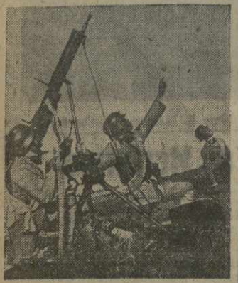
Бойцы китайской армии у зенитного пулемета.

По последним сведениям от 29 марта, после прибытия подкрепления, китайские войска снова перешли в контрнаступление.