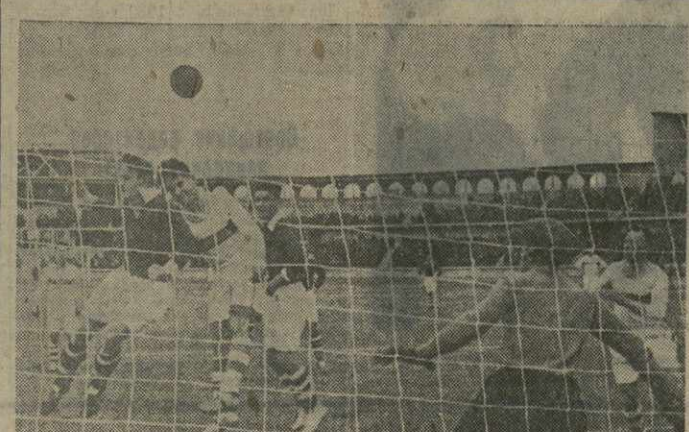
Один из моментов футбольного матча между командами мастеров «Динамо» Тбилиси и Ростова, состоявшегося 30 марта на тбилисском стадионе.