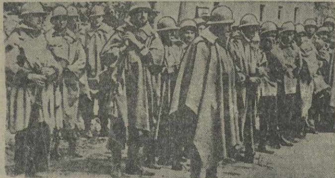
Бойцы испанской республиканской армии на мадридском фронте.