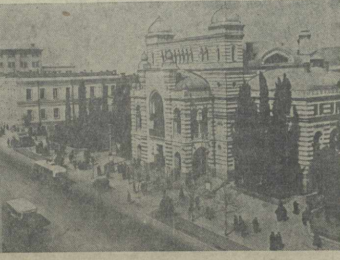
Тбилиси. Проспект им. Руставели. На переднем плане — здание Государственного оперного театра им. З. Палиашвили.