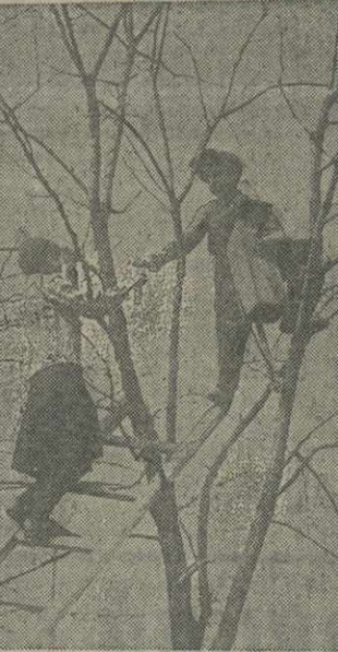
Готовятся к встрече пернатых друзей.

За зиму хор подготовил специальную программу, с которой в дни весенних работ он выступает на полях и плантациях.