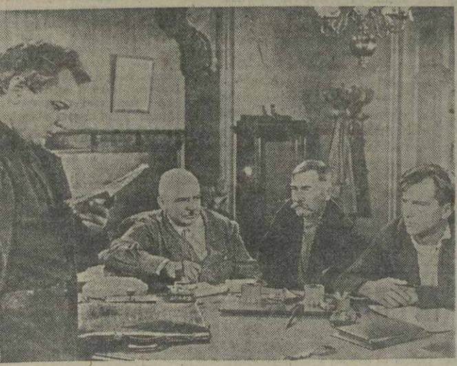
Кадр из фильма «Великий гражданин».